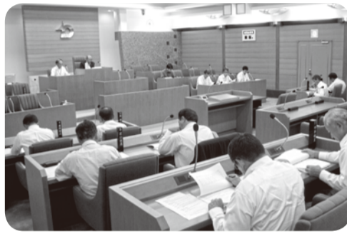
予算決算常任委員会