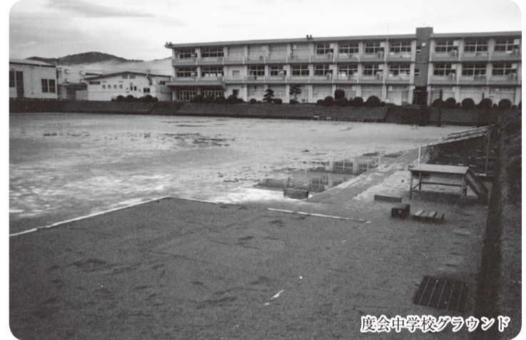
度会中学校グラウンド

度会中学校、度会小学校グラウンド改修工事について―今三重県では、高校インターハイ、三重国体等の選手育成に