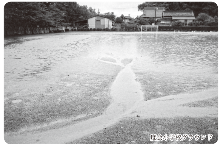
度会小学校グラウンド