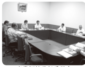
産業福祉常任委員会