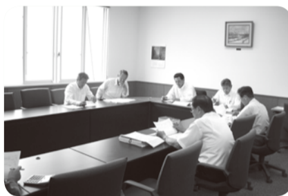
総務教育常任委員会

号)：7750万7000円を追加し、予算の総額を40億828万1000円と定めるもの。