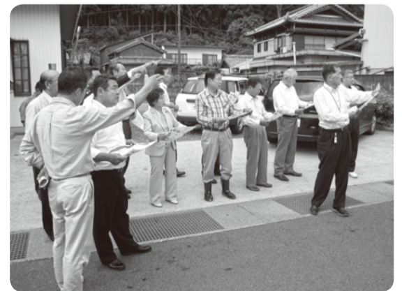
町内視察(南中村地内) 風力発電計画予定地を臨む