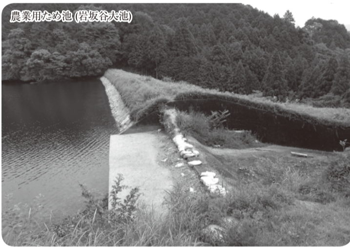
農業用ため池(岩坂谷大池)