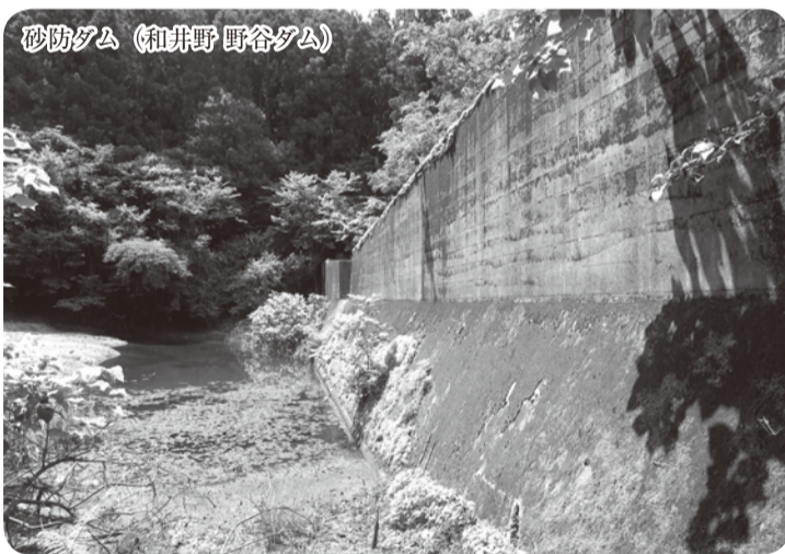
砂防ダム(和井野野谷ダム)