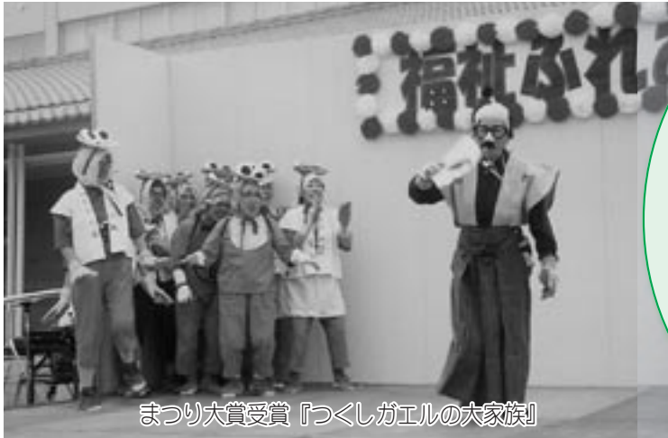
まつり大賞受賞『つくしがエルの大家族』

去る10月24日、度会町地域福祉センターを会場に、福祉・ボランティア活動に関心と親しみを持ち、ふれあいの中で共に生きることを知ってもらおうと『福祉ふれあいまつり』が開催され、たくさんの方が集い、交流を深めました。