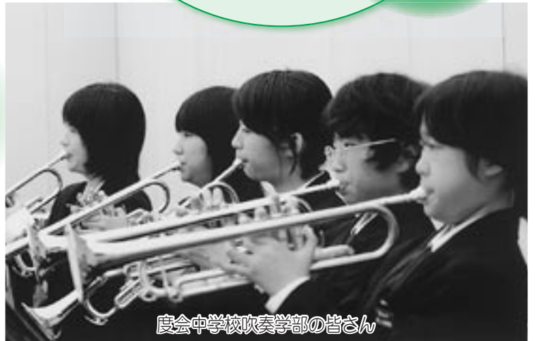
度会中学校吹奏学部の皆さん

福祉体験発表会では、町内各小中学校の代表者6人の皆さんが一日福祉体験を通じて感じ、考えたことなどの作文を発表し、会場内の皆さんに福祉の輪を広げるとともに、共感を得ていました。