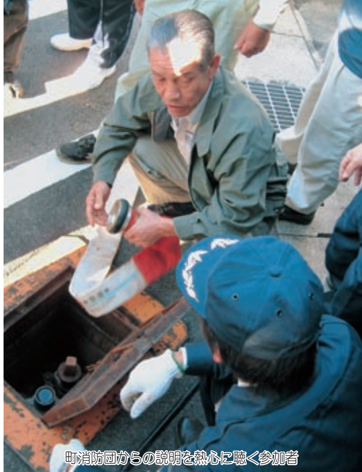
町消防団からの説明を熱心に聴く参加者

去る10月17日、中川各地区避難所および中川小学校を会場に、『中川地区防災訓練』が実施されました。昨年12月に、度会町も東南海・南海地震の推進地域に指定されたことに伴い、大地震を想定し、町民の方が気軽に参加できる体験型の防災訓練として実施されたもので、延べ600人余りが参加しました。 早朝の第1部では、町が地震発生に伴う避難勧告を防災無線で放送後、各字で462人が、公民館など6か所の避難所に避難、安否確認の訓練を行いました。また、町消防団による消火器・消火栓の扱