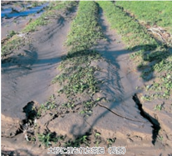
土砂に埋もれた茶畑（長原）

被害状況については現在も調査中であり、早期の復旧を目指しておりますが、完全な復旧には数年かかると思われます。 町では今回のことを教訓に、防災対策、応急対策について、町民の皆さんの意見を反映した施策を実施していきます。 最後になりましたが、今回の災害で被害に遭われた皆さんには、心よりお見舞い申し上げますとともに、避難者への援助や復旧活動にご尽力いただいた皆さんにお礼を申し上げます。