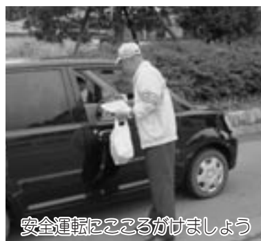
安全運転をこころがけましょう