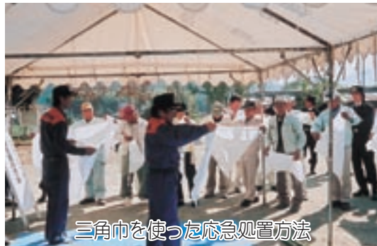
三角巾を使った応急処置方法

を、伊勢市消防本部の方が消火器の扱い方、三角巾を使った応急処置の方法を指導し、参加者も実際に手に触れ体験をしました。県防災危機管理局の職員による講演（図上訓練）や避難食の試食、阪神大震災などの災害状況パネル、防災グッズの展示なども行われました。 三角巾を使った応急処置や、消火器での消火、消火栓の取り扱いなどは、初めて体験したという人も多く、とまどい