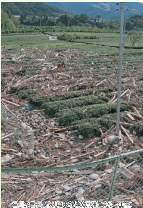
宮川の増水により流木などが茶畑にのる（平生）