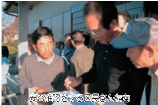
安否確認をする区長さんたち