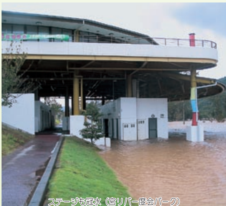
ステージも冠水 (宮リパー度会パーク)