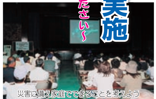
災害に備え家庭でできることを考えよう

家に始終おるもんで、地震が起こったら、ガスとかが心配や。今日は初めて自分で消火器を持たせてもらいました。少し重かったけど自分でもできるかなあと思いましたが。良い経験やったわ。息子の勧めで来たけど、またこんな訓練があったら参加させてもらいます。