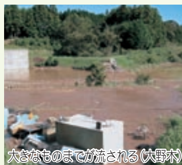
大きなものまでが流される（大野木）