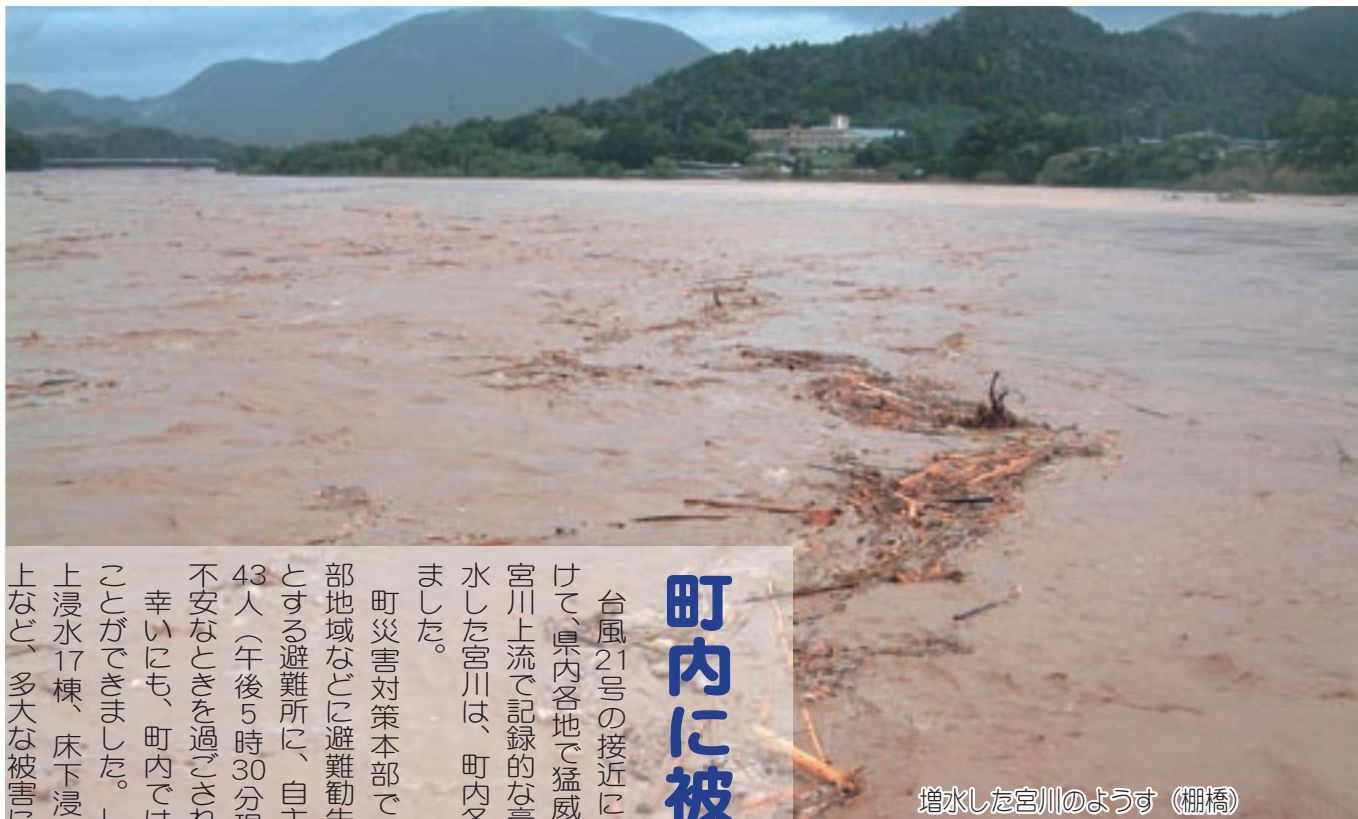
増水した宮川のようにす (棚橋)