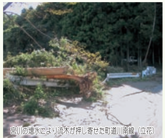
宮川の増水により流木が押し寄せた町道川南線（立花）