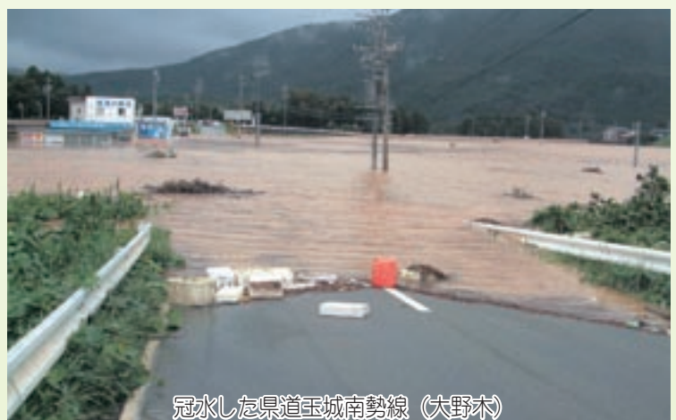
冠水した県道玉城南勢線（大野木）