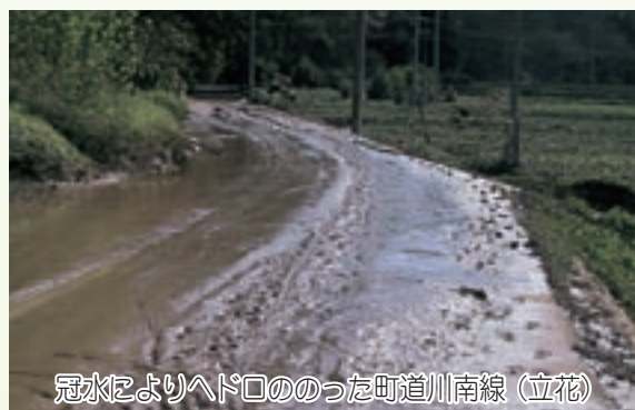
冠水によりヘッド口ののった町道川南線 (立花)

幸いにも、町内では人命にかかわる被害は免れることができました。しかしながら、各地で家屋の床上浸水17棟、床下浸水11棟、道路の冠水17か所以上など、多大な被害に見舞われました。