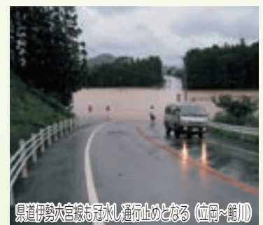
県道伊勢大宮線も冠水し通行止めとなる（位岡～錦川）