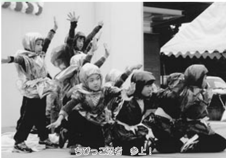
ちびっこ忍者 参上!

場内では、ルーレットやホールインワンゲーム、車椅子体験、点字・手話体験、各種バザーなどが行われ、また、ステージでは、度会中学校吹奏楽部の演奏や、保育園児による歌や踊り、仮装ストリートダンス大会など、様々な催しが繰り広げられ、笑顔で溢れました。