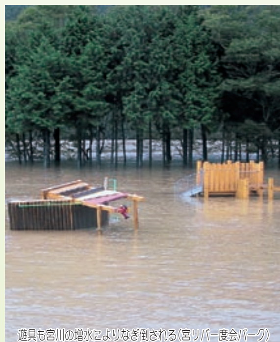
遊具も宮川の増水によりなぎ倒される (宮リパー度会パーク)