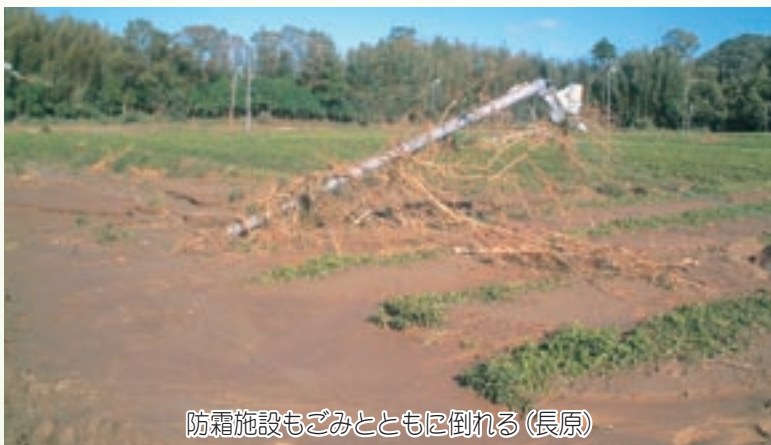
防霜施設もごみとともに倒れる（長原）

被害状況については現在も調査中であり、早期の復旧を目指しておりますが、完全な復旧には数年かかると思われます。 町では今回のことを教訓に、防災対策、応急対策について、町民の皆さんの意見を反映した施策を実施していきます。 最後になりましたが、今回の災害で被害に遭われた皆さんには、心よりお見舞い申し上げますとともに、避難者への援助や復旧活動にご尽力いただいた皆さんにお礼を申し上げます。