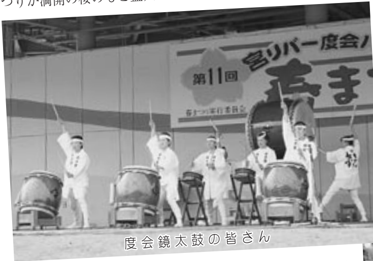
度会鏡太鼓の皆さん

よるフラメンコ、バンドP-sinの演奏、大声大会、そして勇壮な度会鏡太鼓と童太鼓の演奏とさまざまな催しが繰り広げられました。