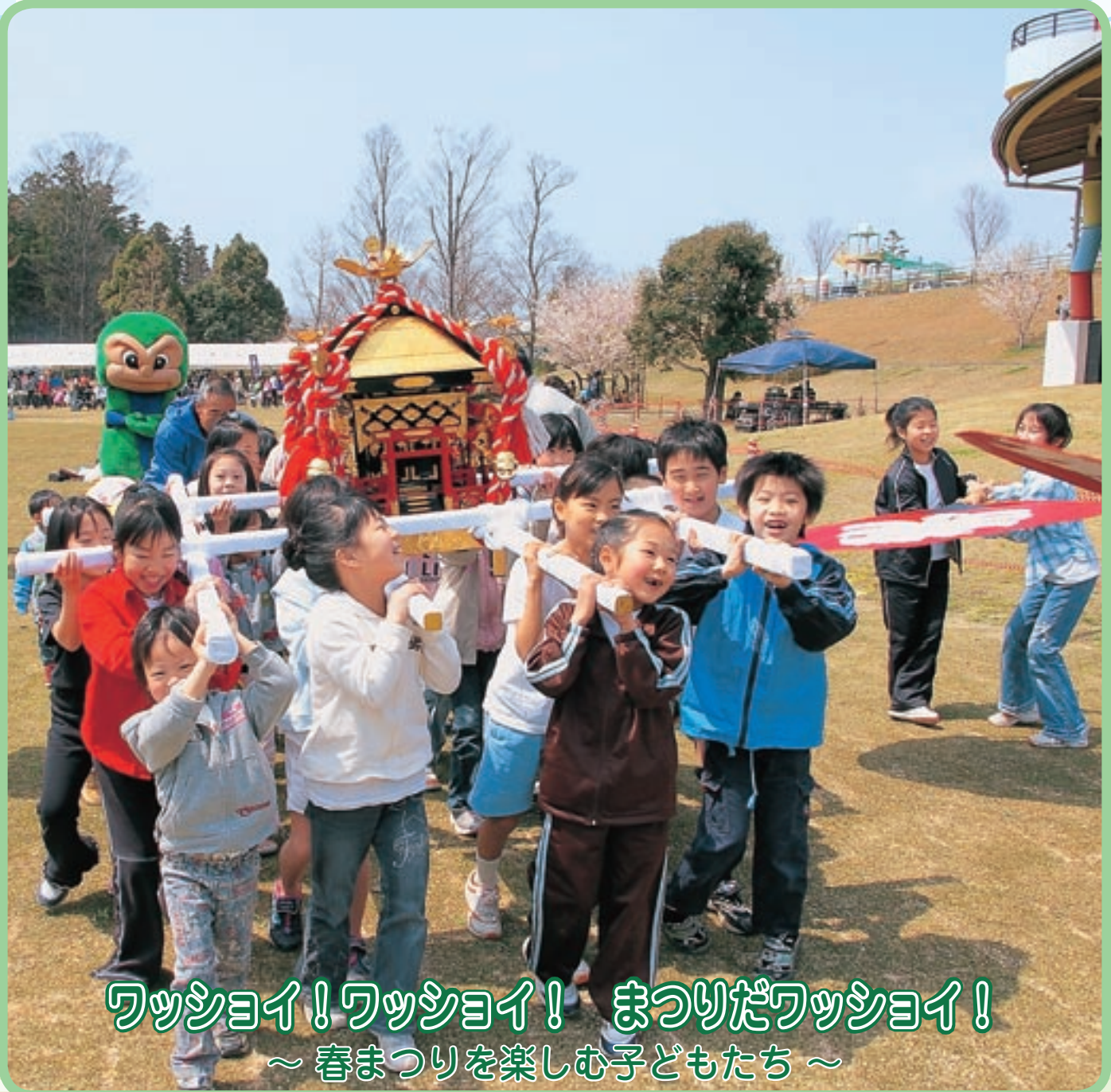
ワッショイ！ワッショイ！ まつりだワッショイ！ ～ 春まつりを楽しむ子どもたち～