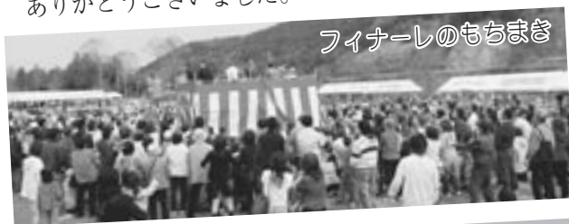
フィナーレのもちまき