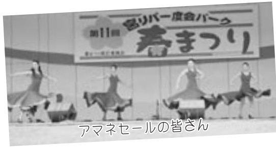
アマネセールの皆さん

去る4月9日、第11回宮リバー度会パーク春まつりが満開の桜のもと盛大に開催されました。