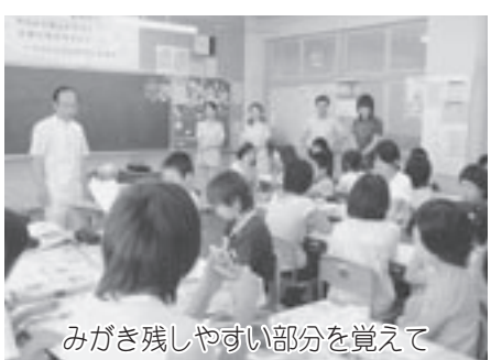
みがき残しやすい部分を覚えて