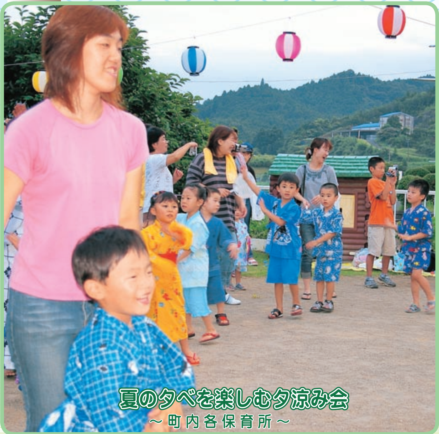
夏の夕べを楽しむ夕涼み会 ～ 町内各保育所 ～