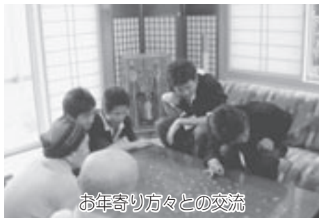
お年寄り方々との交流