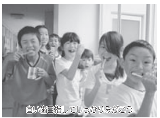
白い歯目指してしっかりみがこう