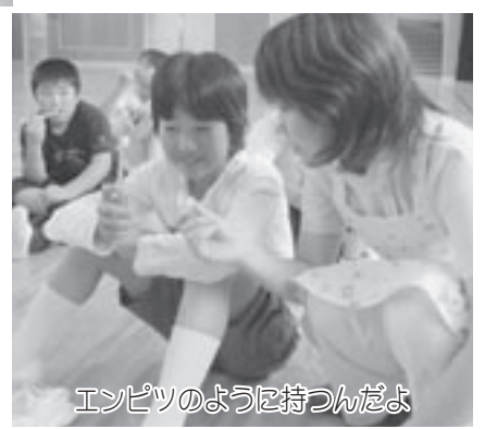
エンピツのように持つんだよ

※次回は10月号で、小学校・保護者・行政機関、各グループの中間取組み状況の報告などを掲載します。