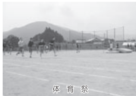
体 育 祭

まさに、全校生徒一丸となって『完全燃焼』した1日でした。今回の頑張りを次の行事やこれからの学校生活につなげていきたいと思います。