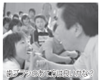
歯ブラシのあて方は良いかな？