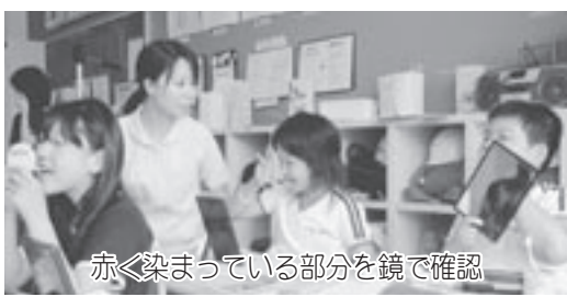
赤く染まっている部分を鏡で確認