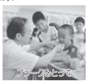
プラークをとって