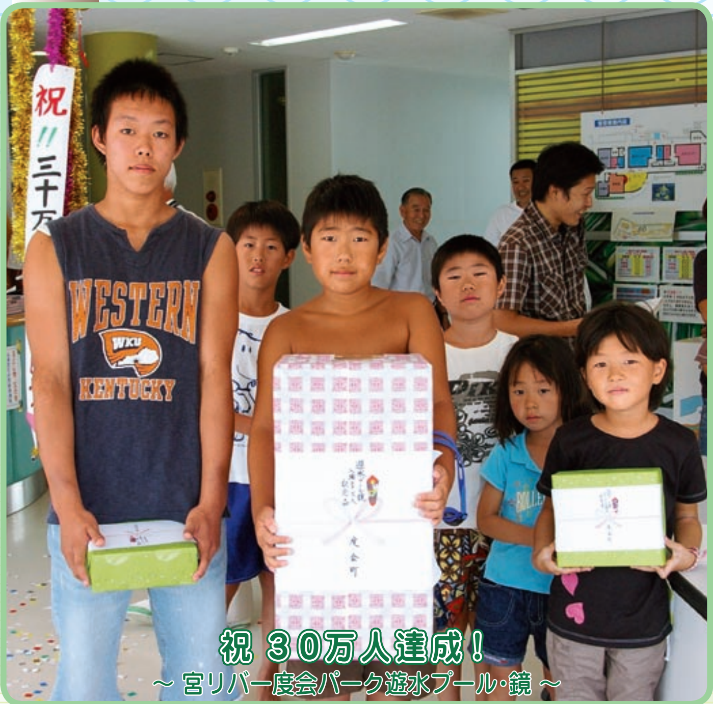
祝 30万人達成! ～ 宮リバー度会パーク遊水プール・鏡 ～