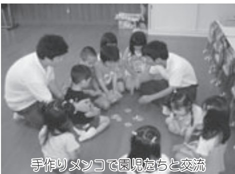
手作りメンコで園児たちと交流

初回の5月19日には、生徒会役員や交流文化部の生徒らは園児とともに輪投げや魚釣りゲームを行いました。2回目の6月13日には、度会校舎の体育祭で、音楽に合わせて一緒に体操をしたり、園児と生徒がペアになって障害物競走を行いました。また、3回目の6月23日には、生徒の手作りメンコで園児たちと交流しました。