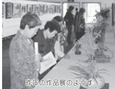
昨年の作品展のようす