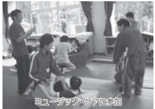
ミュージック・ケアに参加

また、音楽の特性を生かして運動感覚や知的機能の改善を促すミュージック・ケア(音楽療法)に参加した生徒たちは、最初こそ養護学校の生徒たちへの接し方がごちなくも見えましたが、最後には「みんなとコミュニケーションをとれて楽しかった。また次回、みんなと一緒に楽しめるといいなと思う」と話していました。