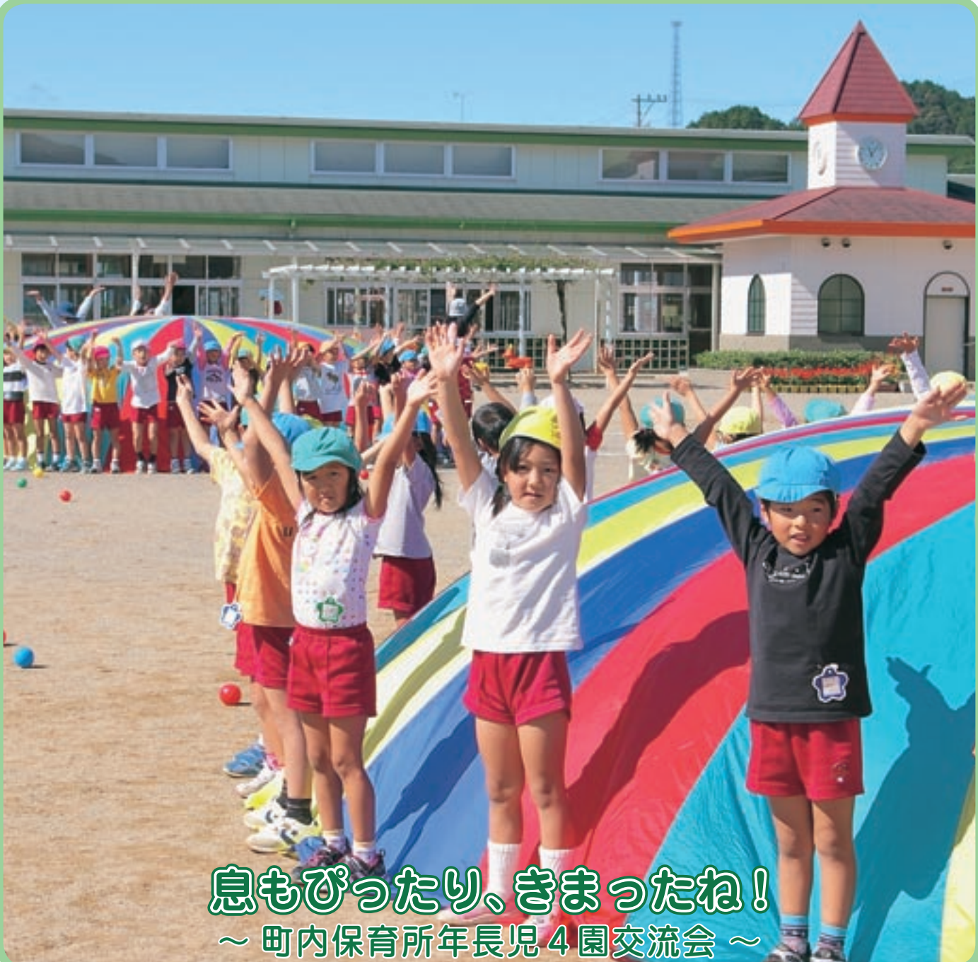
息もぴったり、きまったね！ ～ 町内保育所年長児4園交流会 ～