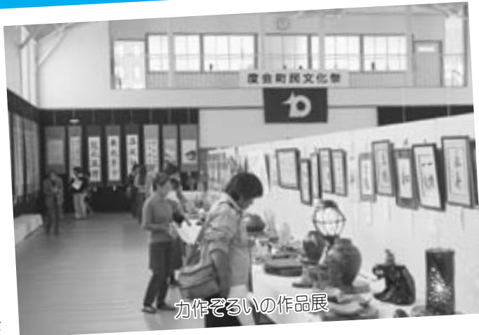
力作ぞろいの作品展

また、度会町食生活改善推進協議会の皆さんによる『健康食試食コーナー』では、たくさんの人がカルシウムたっぷりの炊き込みご飯と鬼まんじゅうを味わっていました。