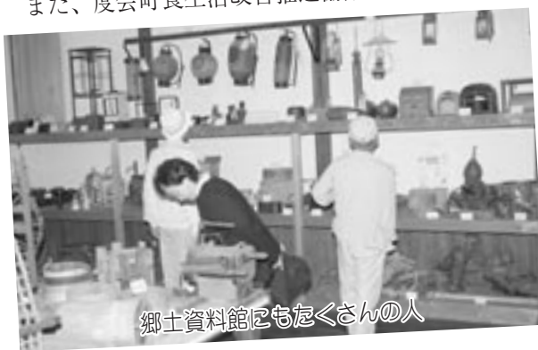
郷土資料館にもたくさんの人