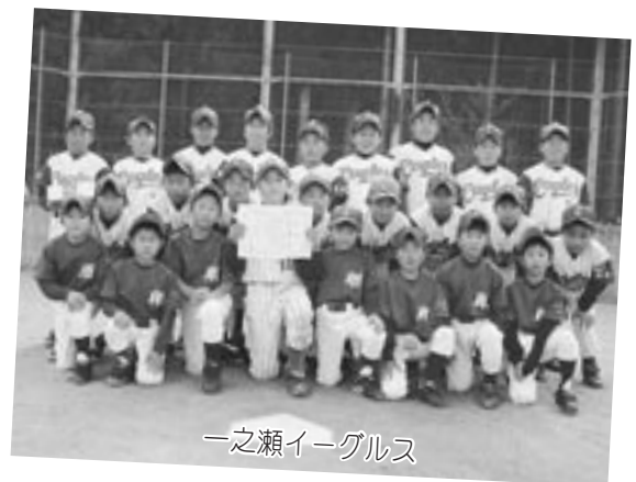
一之瀬イーグルス

去る11月12日、中川小学校グラウンドと第2グラウンドを会場に第21回度会町少年ソフトボール大会が、4チームによるリーグ戦で開催されました。