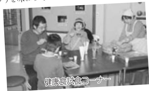
健康食試食コーナー