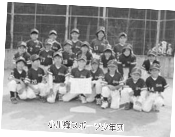
小川郷スポーツ少年団