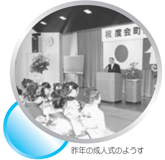
昨年の成人式の様子

町では、新しく成人となる人を対象とし、1月7日(日)にお祝いの式典を開催します。