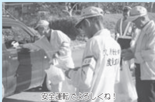
安全運転でよろしくね!

年末の交通安全県民運動 運動の重点 ● 飲酒運転の根絶 ● 高齢者の交通事故防止 ● 後部座席を含むシートベルトとチャイルドシートの正しい着用の徹底 交通安全街頭指導を実施 町では、年末の交通安全県民運動期間中に街頭指導を実施します。 ▽実施日時 12月16日(土) 午前7時30分～ ▽実施場所 大野木地内交差点付近 ▽問合先 役場総務企画課 (☎62-1111)