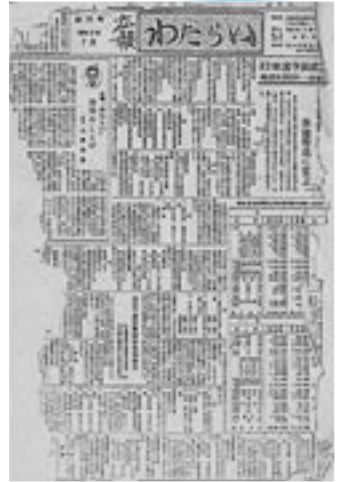
創刊号(昭和32年7月号)

皆さまのご支援をいただき、『広報わたらい』は今月号で創刊から500号を迎えます。 昭和30年4月、中川村、内城田村、小川郷村、一之瀬村の4村が合併し、『度会村』が誕生してから2年3か月後の昭和32年7月、まちの話題をお知らせする広報紙として『広報わたらい』創刊号が発行されました。 創刊号は一般会計4千8百万円余の予算成立記事で始まり、6月末の人口は10,139人、世帯数は1,822戸で、農業が主産業の町らしく農業関係の記事が大部分を占める広報紙でした。 今後とも、『広報わたらい』をご愛読いただきますようお願いいたします。