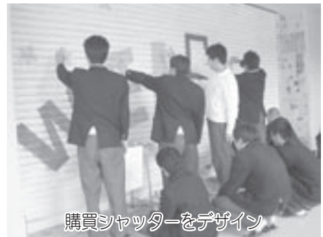
購買シャッターをデザイン

度会校舎3年生は入学当初から総合学習や学校行事を通して、『地域に学ぶ』『生き方に学ぶ』をテーマにし、度会町在住の方や施設にて地域の良さを教わりながら、地域の皆さんと交流させていただきました。茶摘み体験や清流宮川で行う実習は貴重な経験になり、養護学校、保育所、福祉センター、ケアハウスでの交流は印象深いものになりました。卒業後には多くの生徒が地元就職し、町内でお世話になる機会もたくさんあるかと思えます。どうか地域の一員として、度会校舎卒業生を今後ともよろしくお願い致します。