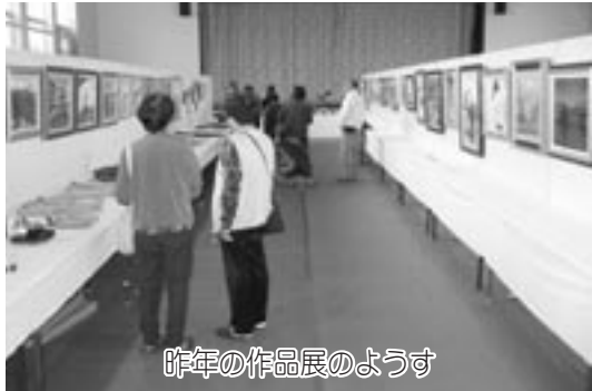
昨年の作品展のようす