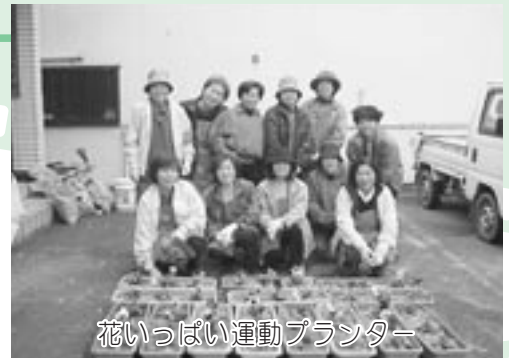
花いっぱい運動プランター