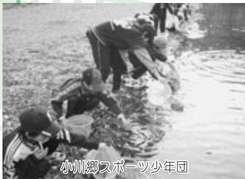
小川郷スポーツ少年団