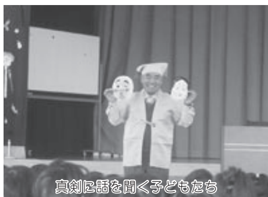
真剣に話を聞く子どもたち