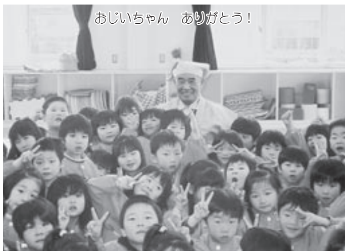
おじいちゃん ありがとう!