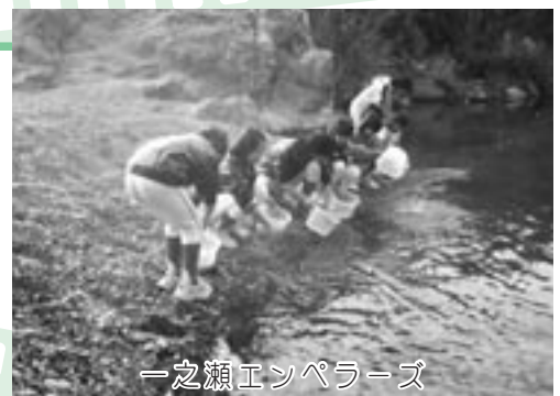
一之瀬エンペラーズ