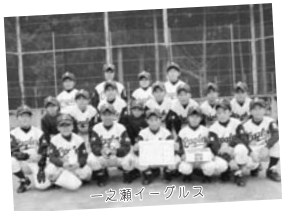
一之瀬イーグルス

これに先駆け同月3日、役場において出場選手の激励会が行われ、選手は健闘を誓いました。