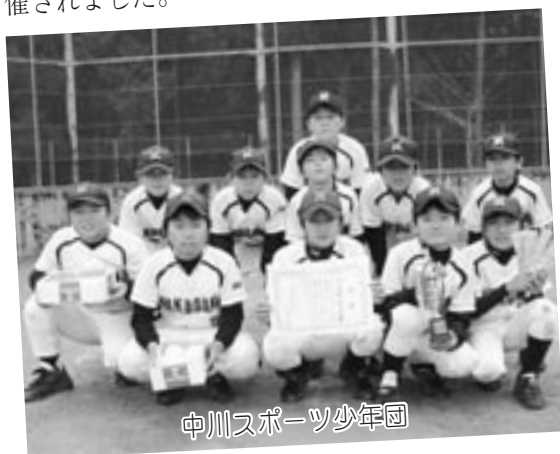
中川スポーツ少年団

去る11月24日、中川第2グラウンドを会場に第23年度会町少年ソフトボール大会が開催されました。