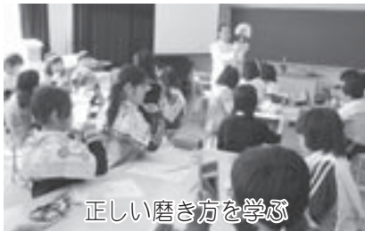
正しい磨き方を学ぶ