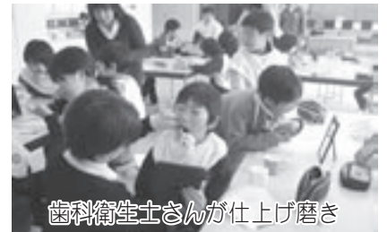
歯科衛生士さんが仕上げ磨き