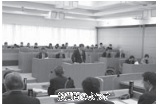
一般質問のようす

平成20年第4回度会町議会定例会は、去る12月9日から16日にかけての8日間で開催され、条例改正案や補正予算案などについて審議し、それぞれ原案どおり可決・承認されました。