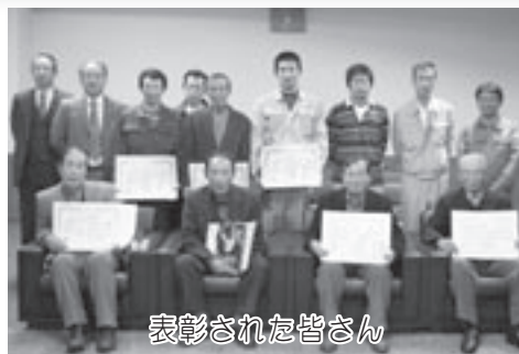
表彰された皆さん

去る12月16日、各種品評会入賞者ならびに三重県茶業功労者賞状伝達式が役場にて行われました。