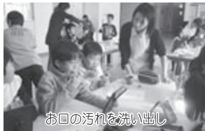
お口の汚れを洗い出し