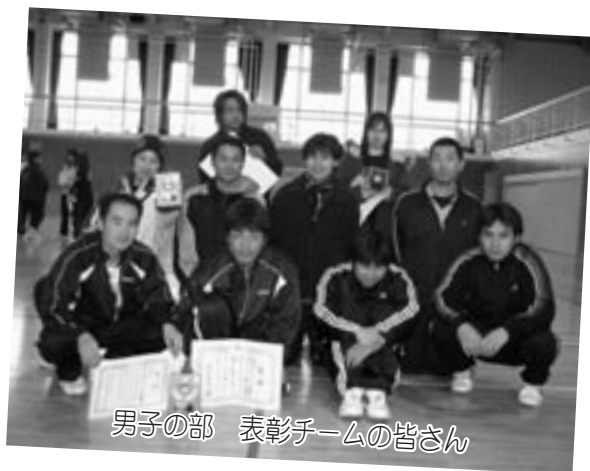
男子の部 表彰チームの皆さん

去る1月18日、度会中学校体育館を会場に、第19年度会町民ビーチボール大会が開催されました。