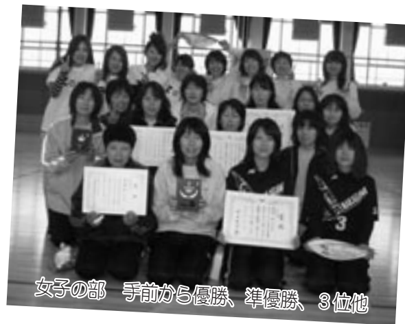
女子の部 手前から優勝、準優勝、3位他