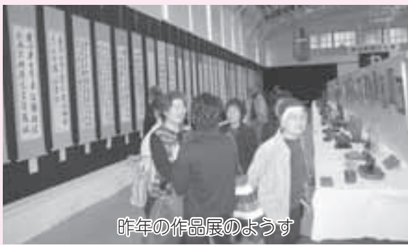
昨年の作品展のようす