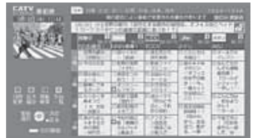
電子番組表(EPG)画面例