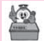
県警シンボルマスコット「ミーボくん」