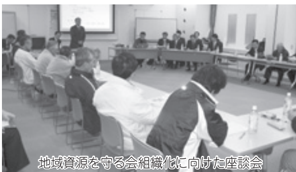
地域資源を守る会組織化に向けた座談会

数 の皆さんからご応募いた きましたので、本年度から は、「ガイドの育成」と「宮 川流域の日帰り観光スポッ トづくり」に取り組みたいと考 えています。