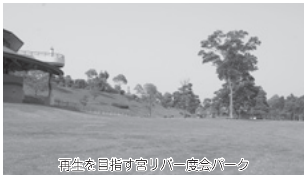
再生を目指す宮リバー度会パーク

依存度、多額の借入金残高などにより、経常収支比率・公債負担比率・起債制限比率などの指標が悪化し、財政が硬直化しています。 施策・事務事業の効率化・取捨選択・重点化を徹底 本町の財政は、歳入の60%以上が地方交付税などの依存財源であり、歳出における義務的経費が40%を超過しており、財政の硬直化の傾向が示される中、限られた財源の中で施策の選択を行い、成果重視の行財政運営を行っていかなくてはなりません。