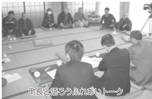
町長と語ろうふれあいトーク

公約の1つとしました「町長と語ろうふれあいトーク」を、各地区でこれまでに2回開催し、土・日曜の昼間でしたが、町民の皆さんから意見や発想を直接お聴きし、少なからず町政に反映することが