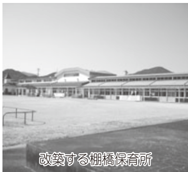
改築する棚橋保育所

成23年度の行政課題としましては、棚橋保育所の改修をはじめとした「子育て環境の充実」、歴史・文化や名勝・旧跡の保全と農業振興、過疎化対策など、町の活性化を目的に包括的に解決を図る「日帰り観光施策」や、その窓口となる「宮リバー度会パークの再整備事業」、生活道路整備や上水道への移行をはじめとした「インフラ整備」などの実施と、第6次総合計画前期基本計画に基づく諸施策の着実な実行が課題となっています。 これを踏まえた平成23年度の予算編成方針は、任期満了を間近に控え、町政運営の基本となる経費を中心とした、いわゆる「骨格予算」としてはありますが、棚橋保育所の耐震改築や簡易水道統合事業などを主として、一定程度の継続事業については当初予算に計上することとしています。