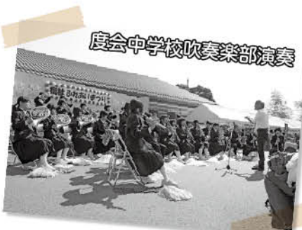
度会中学校吹奏楽部演奏