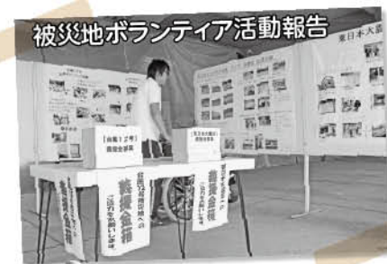
被災地ボランティア活動報告

高齢者疑似体験で、ゴーグルとヘッドホンを身に付けると、視野は半分ほどになり、聴覚は水中に潜ったような、耳鳴りがしているような状態になりました。この状態で日常生活を送るのは非常に危険だと感じます。お年寄りには、周りの方のサポートが必要です。