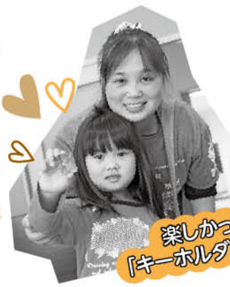
楽しかった 「キーホルダー作り」