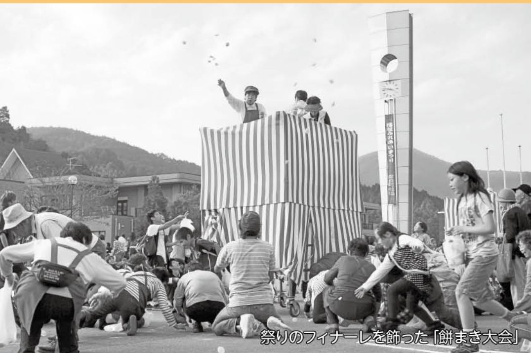
祭りのフィナーレを飾った「餅まき大会」

秋晴れの空の下、大勢の人でにぎわい、たくさんの方々の笑顔と歓声に包まれる祭典となりました。