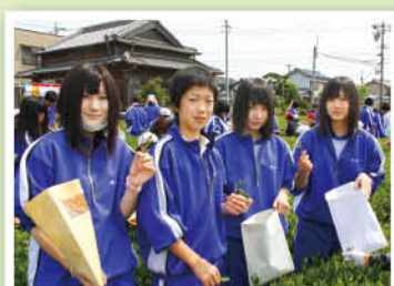
南伊勢高校度会校舎

初めてお茶摘みをして、むっちゃ楽しかった。最初は難しかったけど、慣れてきたら簡単にできました。この葉がどうやってお茶になるのか不思議です。