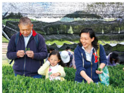
【新茶の手摘み体験をする親子】

生徒らは、県の農業改良普及指導員から摘み方の説明を受けた後、次々に新芽を摘み取り、茶摘み終了後には、新芽と古い芽の色の違いや一番茶・二番茶などの意味について質問し、同指導員から丁寧に教えてもらいました。