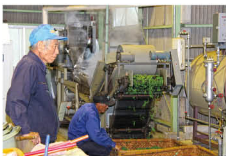
【蒸器で茶葉を蒸すようす / 製茶研修工場】

工場で指導にあたる県の農業改良普及指導員によると、今年は春先の低温で生育は平年より5、6日遅くなったが、萌芽期（4月初旬）以降に霜が下りず、夜間の気温も最適であったことから、三重県産地賞を受賞した昨年同様品質の良いお茶に仕上がるとのこと、各種品評会にも期待が寄せられています。