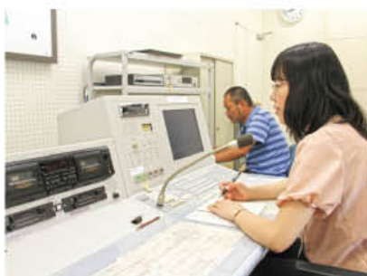
【役場防災無線室のようす】

J・ALERT とは、武力攻撃や地震、津波などの対処に時間的余裕のない事態が発生した場合に、通信衛星（地