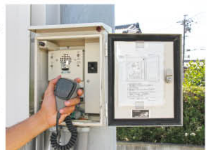
【双方向通話機能を備えた子局】

そこで国（消防庁）では、この課題に対応するために全国瞬時警報システム（ J・ALERT ）を整備し、度会町においては平成23年4月1日から運用を開始しました。