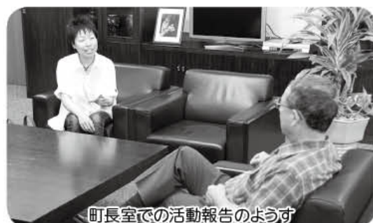
町長室での活動報告のようす

最後に、私は今後も、そもそも『～人』という線引きではなく、『同じ今を生きる、でも育った環境や言語、文化などが異なる隣人』として、中国に限らず、さまざまなルーツを持つ人同士がお互いにできるだけ気持ちよく生活できるように、自分のできることをしていきたいと思っています。