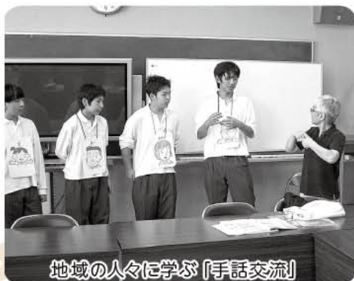
地域の人々に学ぶ「手話交流」

人権学習は、人権LHRだけではなく、学校生活全体に関わって行われています。人権学習の目標が「自分たちを取り巻く問題を主体的にさまざまな視点から考え、みんなで解決の道を探る力を身に付ける。違いや対立を乗り越え、新しい社会（人間関係）をつくる力を身に付ける」ということであるなら、生徒たちはそのための学びを、体育祭や文化祭、総合学習の時間などでクラスの仲間や担任と共に十分経験する機会を持っています。学校生活の中で、また校外のさまざまな方々と交流することを通して、多面的なもの