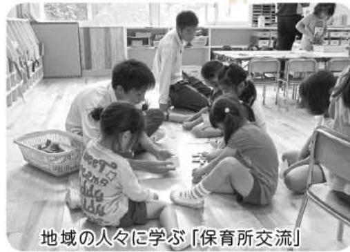
地域の人々に学ぶ「保育所交流」

の見方や認識を身に付け、少しずつ「人権」に向き合う力を養っていているように思います。