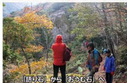
「語り石」から「おうむ石」へ