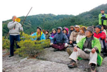
【乙女岩から絶景を眺めるようす】

乙女岩の頂上は、5m四方の凹凸のない平らな場所。岩の隙間には松が根付き風情が漂っています。