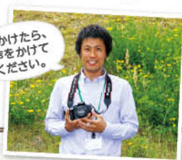
見かけたら、声をかけてください。