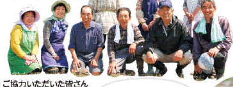
ご協力いただいた皆さん