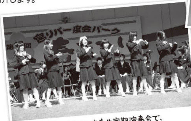
町イベントでの演奏や定期演奏会で、ぜひ度会中サウンドをお楽しみください。