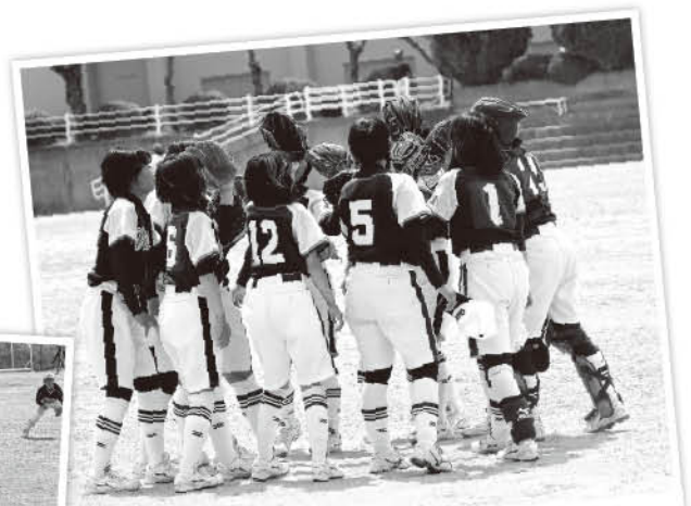
元気いっぱいの新1年生4人が入部し、総勢12人になりました。チームの雰囲気も良く、練習や試合で大きな声がよく出ています。