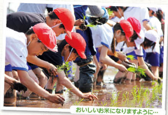
おいしいお米になりますように...

家庭や学校給食で当たり前のように口にしている「米」ですが、農業の大変さを経験したことで、米一粒一粒の大切さを学ぶことができたはずで