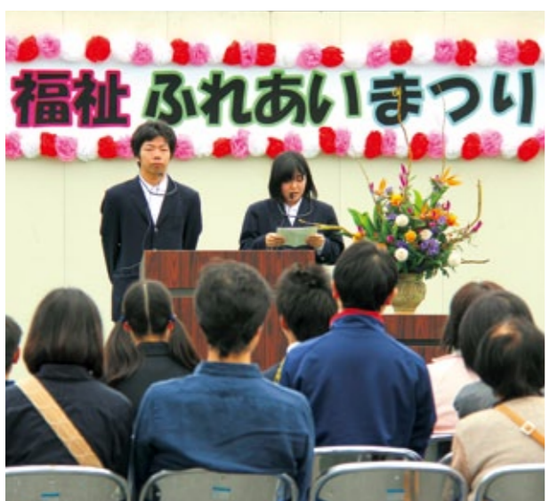
南伊勢高校の生徒による福祉体験発表