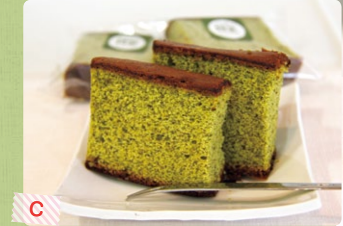
茶カステラ 120円 煎茶の芳醇な香りが広がる、ふっくら柔らかな食感のカステラ