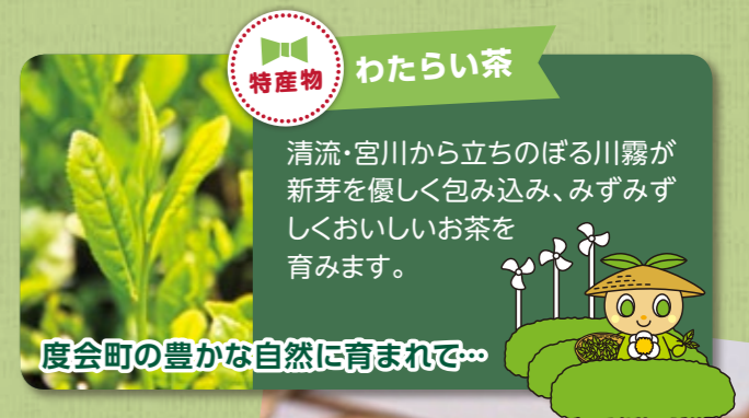
特産物 わたらい茶 清流・宮川から立ちのぼる川霧が新芽を優しく包み込み、みずみずしくおいしいお茶を育みます。 度会町の豊かな自然に育まれて…