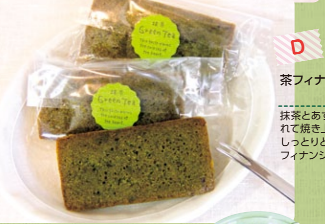
茶フィナンシェ 130円 抹茶とあずきを入れて焼き上げた、しっとり濃厚なフィナンシェ