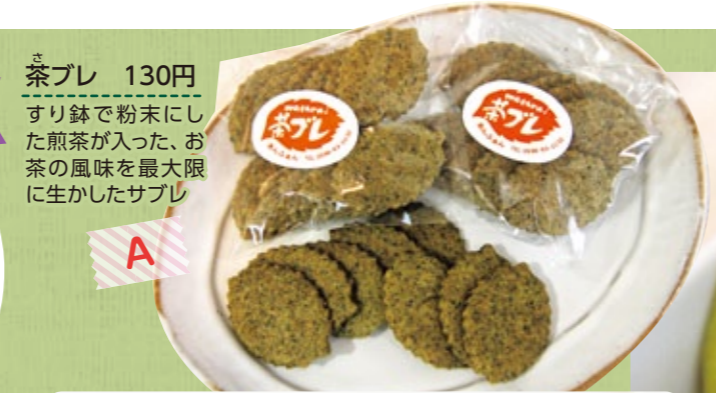
茶ブレ 130円 すり鉢で粉末にした煎茶が入った、お茶の風味を最大限に生かしたサブレ

町では、新たな特産物でまちおこしをしようとして、平成22年に「度会町ブルーベリー部会」が設立され、町の気候に適した品種や栽培方法の研究を行ってきました。ブルーベリーは町内外への果実出荷だけでなく、平成23年には「ジャム」として販売され、今年2月には、「三重の「いいとこ」ぜんぶ日本橋へ」をテーマにした県アンテナショップ「三重テラス(東京都中央区)」に併設するレストランで、食材として使用されるなど、多くの方々に食されています。 度会町ブルーベリー部会 〒62-2416 度会町役場産業振興課