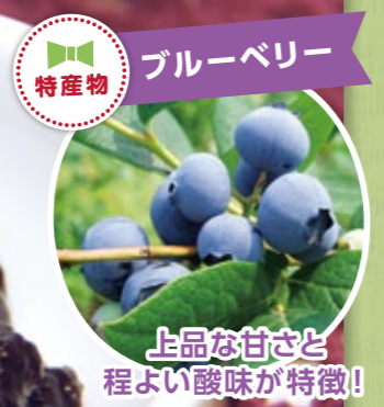
特産物 ブルーベリー 上品な甘さと程よい酸味が特徴!