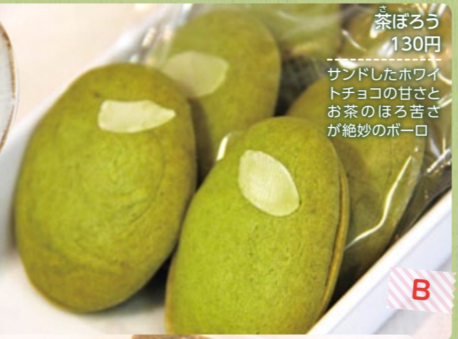
茶ぼろう 130円 サンドしたホワイトチョコの甘さとお茶のほろ苦さが絶妙のポーロ