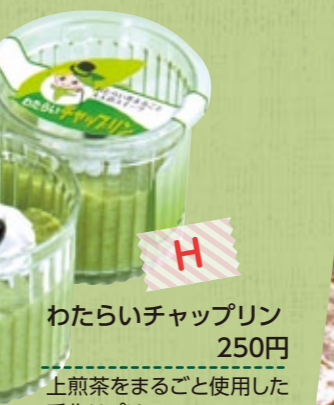
わたらいチャップリン 250円 上煎茶をまるごと使用した手作りプリン。お茶の味と香りが口中に広がる大人のスイーツ!