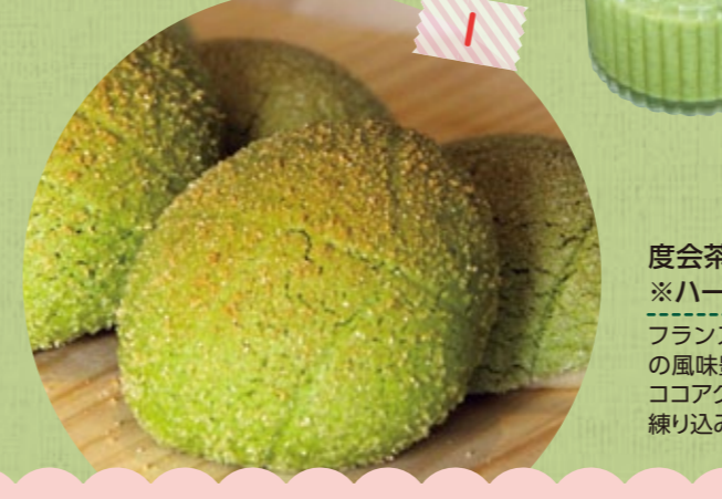
度会茶カンパーニュ 700円 ※ハーフサイズ 350円 フランス製石窯で焼き上げた、お茶の風味豊かなカンパーニュ。ココアクッキーとホワイトチョコを練り込み、子どもにも好評の一品!