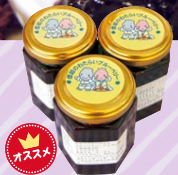
オススメ ブルーベリージャム 500円 ブルーベリーの爽やかな風味と芳醇な果実の味わいをそのままに、絶妙な甘さ加減のジャム。ヨーグルトに加えるのがオススメ!

町では、新たな特産物でまちおこしをしようとして、平成22年に「度会町ブルーベリー部会」が設立され、町の気候に適した品種や栽培方法の研究を行ってきました。ブルーベリーは町内外への果実出荷だけでなく、平成23年には「ジャム」として販売され、今年2月には、「三重の「いいとこ」ぜんぶ日本橋へ」をテーマにした県アンテナショップ「三重テラス(東京都中央区)」に併設するレストランで、食材として使用されるなど、多くの方々に食されています。 度会町ブルーベリー部会 〒62-2416 度会町役場産業振興課