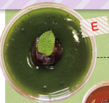
茶ゼリー・ほうじ茶ゼリー・伊勢紅茶ゼリー 各100円 お茶の香りが口いっぱいに広がり、あんことの相性も抜群のゼリー

ちやちや茶々丸・茶々姫 各300円 【茶々丸】カリッと、中からかぶせ茶がはじけるキャンディ 【茶々姫】香ばしいほうじ茶味のやわらかく、なめらかなソフトキャンディ