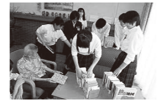
生徒らによる移動図書館 (ケアハウス伊勢度会彩幸)

詳しくは、『町ホームページ』または『南伊勢高校ホームページ』でご確認いただけます。取組状況や生徒の様子を随時お伝えしていきますので、ぜひご利用ください。