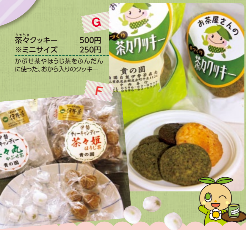
茶々丸クッキー 500円 ※ミニサイズ 250円 かぶせ茶やほうじ茶をふんだんに使った、おから入りのクッキー

ちやちや茶々丸・茶々姫 各300円 【茶々丸】カリッと、中からかぶせ茶がはじけるキャンディ 【茶々姫】香ばしいほうじ茶味のやわらかく、なめらかなソフトキャンディ