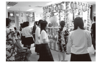
夏祭り交流 (町社会福祉協議会)