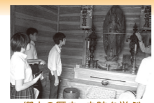
郷土の歴史・史跡を学ぶ (注連指正法寺)