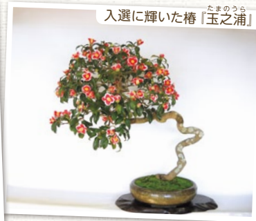
入選に輝いた椿「玉之浦」