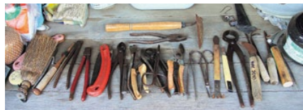
木によって道具を使い分けます。