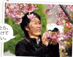
編集担当 大西 泰正

今回の取材を通して、「自分らしくいられる場所、そして夢中になれるものに出会うということは幸せなことで、人生を豊かにしてくれる」とあらためて実感しました。