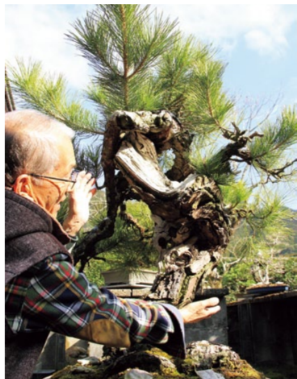
椿に続く自信作の「黒松」