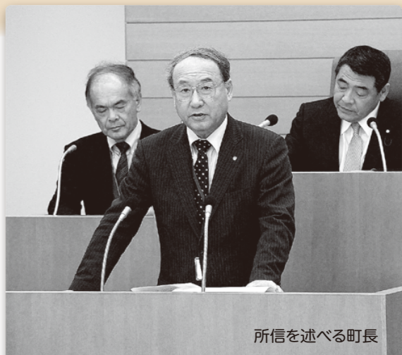
町長を述べる町長