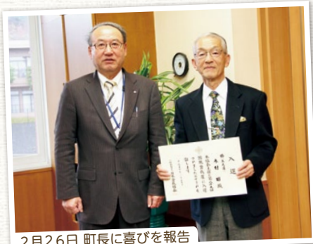
2月26日 町長に喜びを報告

教員を退職後は盆栽の手入れをする時間が増え、「木が生き生きしてきた」と喜び、「これからも同展での入選にこだわりたい」と力強く話してくれました。