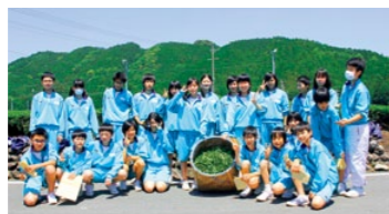
茶摘みのクラス対抗C組が優勝!