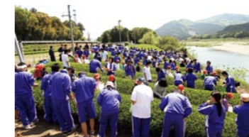
澄み切った青空の下で