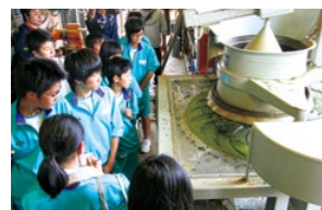
真剣な表情で工場を見学する生徒