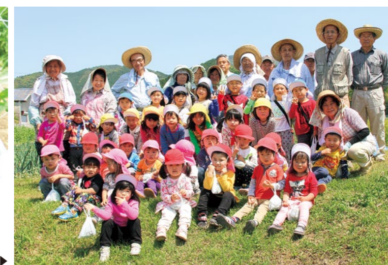
長原営農組合と長原老人会の皆さんと一緒に▶