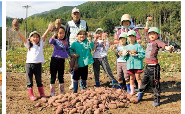
10月28日 中之郷保育所