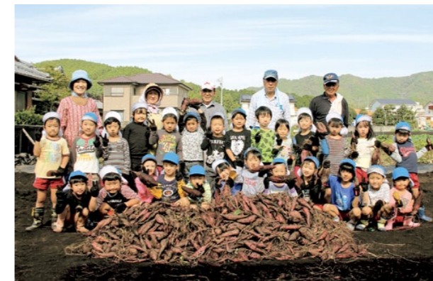
10月27日 棚橋保育所さくら組