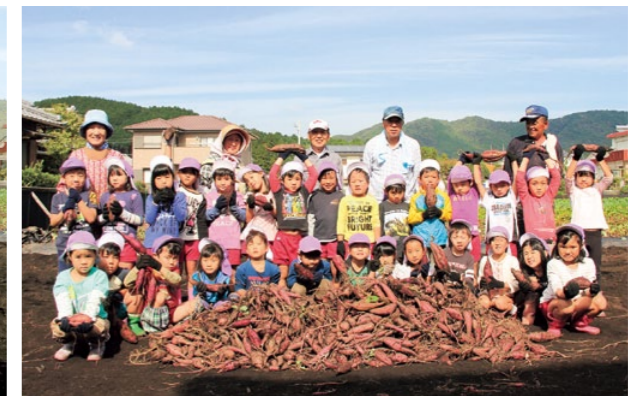
棚橋保育所すみれ組