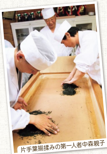
片手葉揃揉みの第一人者中森親子

おすすめの飲み方は『氷出し茶』です。一滴一滴に旨みが凝縮され、まさに緑茶版エスプレッソ。口に含んだ瞬間に旨みと香りが広がり、いつまでも余韻に浸ることができます。