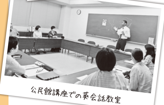
公民館講座での英会話教室