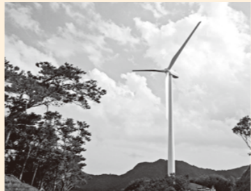
据え付けが完了した風車