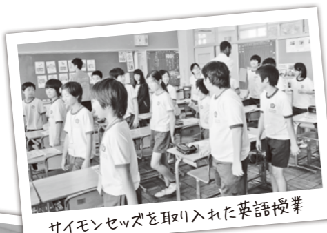
サイモンセッズを取り入れた英語授業

先生は「授業や学校での関わりあいを通じて、英語を身近に感じてもらい、興味を持って勉強に励んでもらえるように努力していきたい。度会町の児童・生徒の良さは、元気と積極的な姿勢。他の外国人と接する機会が訪れたとき、消極的にならずに自ら進んで関係を築いてもらうため、世界に目を向け、英語を身につけてもらえるよう児童・生徒に伝えていきたい」と話してくれました。