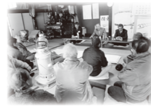
「ふれあいトーク」の様子

町民の皆さんの貴重なご意見・ご要望を伺い、今後の町づくりに反映させることを目的に、第4回「町長と語ろう「ふれあいトーク」」を開催します。