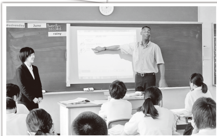
発音練習をする中学生の様子