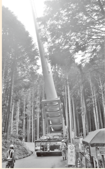
ブレード(風車の羽根)の運搬

7月上旬から、エコ・パワー株式会社の実施する風力発電事業『度会ウインドファーム』の風車本体の設置が始まりました。一部については据え付けが完了し、宮リバー度会パークなど遠方からでも目視できるようにになりました。 また、旧中川小学校付近に、エコ・パワー株式会社の管理棟が完成し、6月末に移転を行いました。 1期工事は年内の完成を予定しており、営業運転開始は平成29年3月頃の予定です。