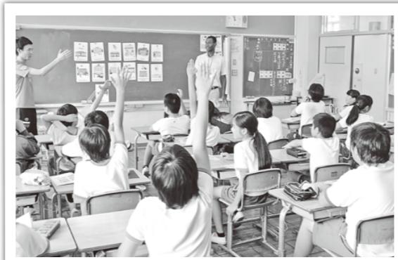
先生の質問に対する小学生の様子