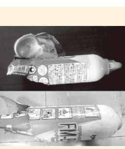
破裂事故を起こしたヤマトプロテック社製エアゾール式簡易消火具

ヤマトプロテック株式会社 ☎0120-801-084 http://www.yamatoprotec.co.jp/ 伊勢市消防本部予防課 ☎25-1268