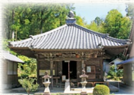
本堂大悲殿(旧荒神堂)

国東寺は、飛鳥時代に、聖徳太子が皇大神宮の神勅で、天照大神と素戔鳴尊の胞衣が納められている国東山に伽藍を建立し、十一面観音立像を安置し、天下泰平、万民豊樂を祈願したと伝えられている。聖武天皇・嵯峨天皇の篤いご信仰で六院百三十二坊を有するまでに発展、平安・鎌倉時代には天台宗の道場として栄