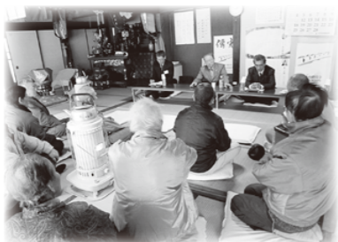
「ふれあいトーク」の様子

お住まいの地区で開催される際は、ぜひご参加いただき、皆さんの声をお聞かせください。