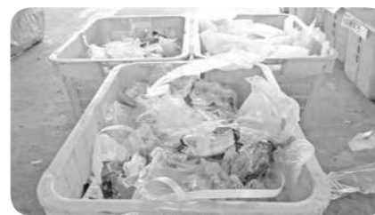
プラスチック製容器包装類