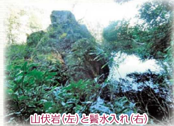
山伏岩(左)と鬢水入れ(右)

なお、鬢水入れに接する北西側に「山伏岩」があります。山岳を信仰し山中で修行する山伏がこの岩の上で祈禱していたと伝えられています。