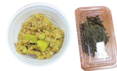
『うけ茶』と『サツマイモの葉がら きゃらぶきもどき』