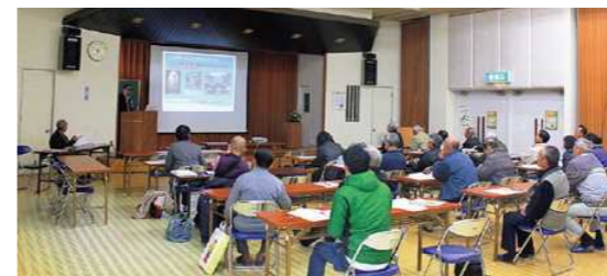
地域資源や文化財について学ぶ