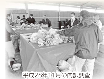
平成28年11月の内訳調査