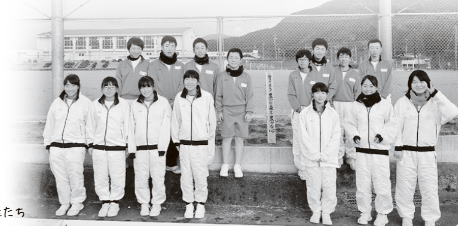
参加した生徒たち

今年度会中学校に植樹したシバザクラの苗木は、「緑の募金」の緑化運動事業に応募し、配布していただいたものを使用しています。