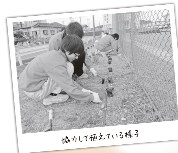
協力して植えている様子

1月13日に、度会中学校の生徒会活動の一環として、ボランティアで集まった約20名の生徒により、中学校校庭西側のフェンス沿いに229本のシバザクラを敷き詰めました。