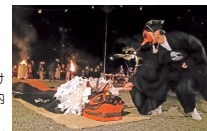
下久具のお頭神事

舞い手たちは「大変だが、やりがいがある」「若手が減ってきて後継者が心配だが、頑張って次世代につなげていきたい」と、力強く語ってくれました。