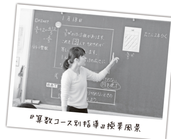
『算数コース別指導』授業風景

子どもたちは授業の中で、問題の解き方について、友達と話し合いながら解答を導き出す場面も見受けられ、「自分で考える」「考えを共有する」授業が浸透していました。