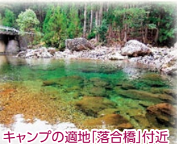
キャンプの適地「落合橋」付近

度会町南中村の梅橋から県道151号線に入り一之瀬川を3.3km位遡ると蝮ヶ瀬橋があり、更に1.5km程行くと道路の左側・一之瀬川上流の右岸に湧き水が2本の筒から豊富に流れてくる、「川上の清水」があります。周りの森林と清流が心を癒してくれる、風光明媚な場所です。