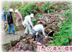
川上の清水「倭姫伝説の神水」