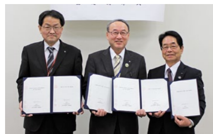
日本郵便株式会社、伊勢農業協同組合