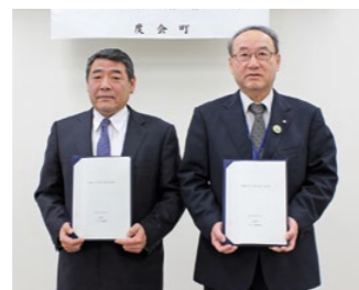
いせしま森林組合

3月下旬、町は、防災・福祉など地域に関する課題に連携して取り組むため、各種団体と協定を締結しました。