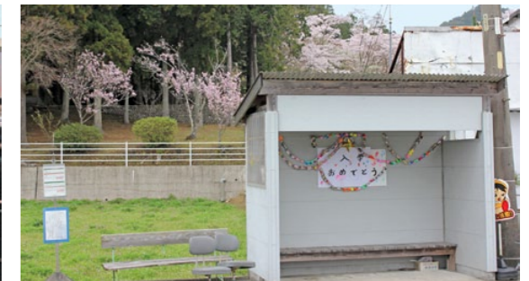
小学校在校生によるお祝いの飾りつけ(長原バス停)