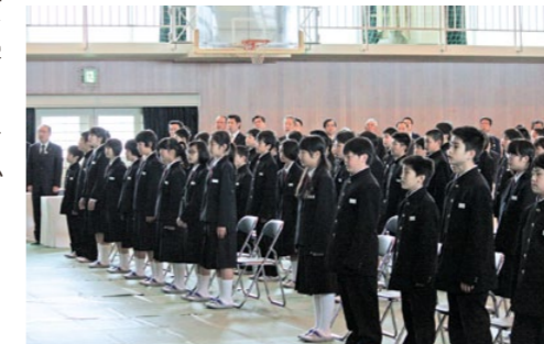
緊張した表情の新入生