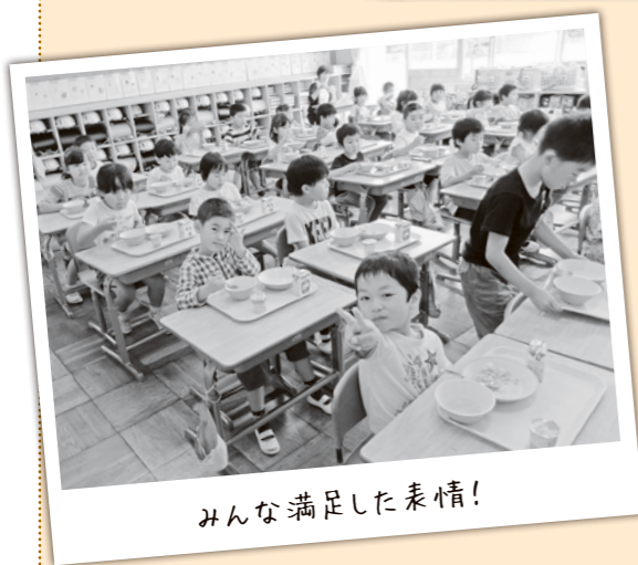
みんな満足した表情!