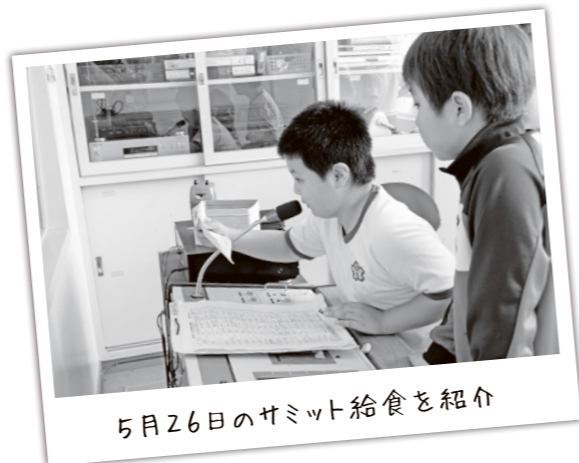
5月26日のサミット給食を紹介

給食の年間目標を決めて各クラスに掲示し、給食の時間には、放送室から校内放送を行い、その日の献立や、肉や魚は「体をつくる食品」といった食品の栄養面などの紹介をしています。また、昨年からサミット給食の献立紹介もしています。