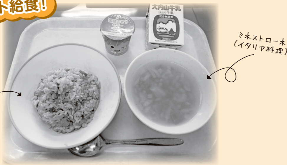
ジャンバラヤ (アメリカ料理)