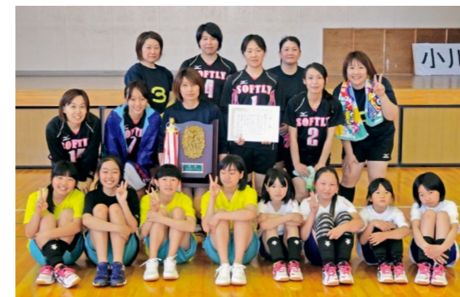
優勝したソフトリー