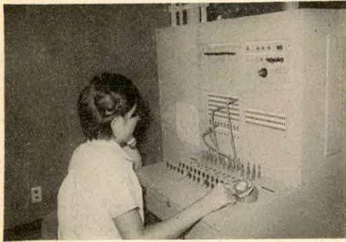
有放センターの局線中継機

なお、公社電話の通話料はこれに含まれていないのでこの取次料とは別に払っていただきます。