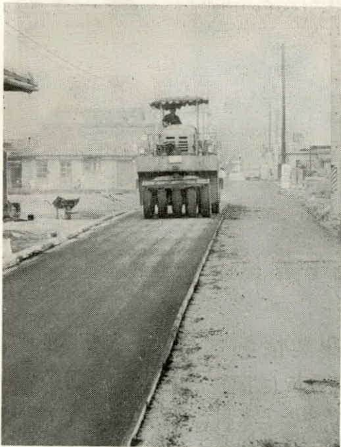
県道度会玉城線、棚橋地内で