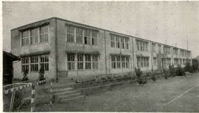
明野高校度会分校

他高校を志願するものが相当あるが、もったこの分校を充実する意味からもご理解をいただきたい。 町長 本人の自由を侵害することはできないが、町唯一の高校として育成して行くうえからも父兄などのご理解を仰ぎたい。それには同校の設備の充実をはかるなど町としてできる限りのことを行きたい。