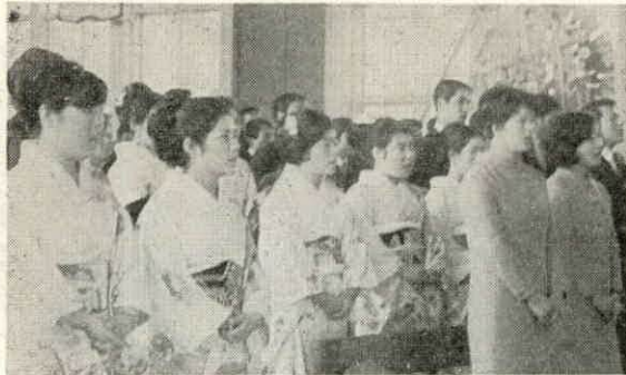
昨年の成人式より