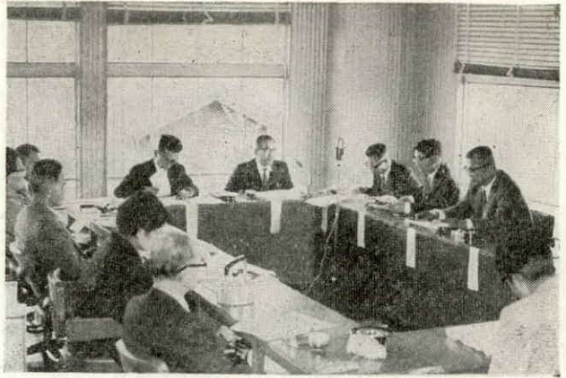
新春座談のひとコマ