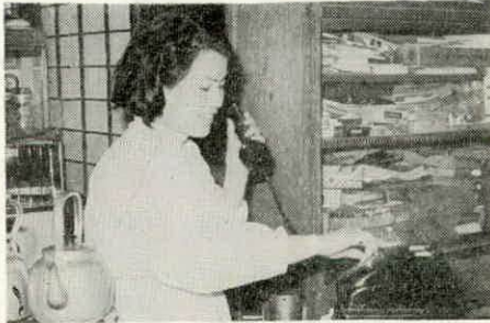
農家に備付けられた電話機

ダイヤル一つで通話OK 電話の普及率が十四割にも満たないと、一之瀬地区にこのほどダイヤル式電話二百余が架設され、二月二十七日から通話が始まりました。