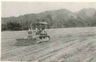
上久具の緑茶団地

大規模な緑茶の団地造成と製茶工場大型機械の導入などをはかるための農業構造改善事業が川南地区(上久具、茶屋広)で行なわれていますが第一年度事業の緑茶の団地造成がほぼ完成に近づいています。 農業構造改善事業は、農業基本法に基づき農業生産の基盤整備や経営の近代化など農業構造の改善を行ない、農業生産の拡大と自立経営の育成をはかるもので、昭和三十六年度から四十五年度まで十六年を目標に実施され、対象事業には国庫5割、県2割の高率の補助事業です。 本町では、四十二年に町全域が事業計画地域に指定されたあと、四十三年七月川南地