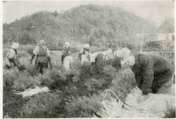
スギ苗の掘取り作業(葛原で)

とき 3月28日 10時~11時 ところ 一之瀬中学校講堂 対象者 小川郷、一之瀬地区の43年2月1日~同年11月30日までに生れた乳児 料金 150円