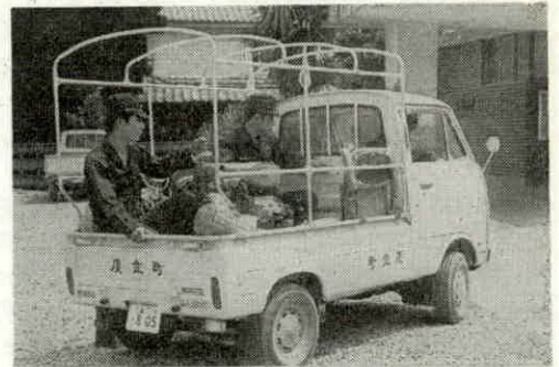
配置された消防搬送車

役場防護団は、役場庁舎の防護と、町内に火災発生した場合、勤務時間内の範囲で消防団員の消火活動に協力するものです。