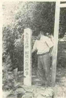
埋もれた文化財を広く知ってもらい長く保存をはかろうと、このほど町教育委員会では、町内の文化財のうち、とりあえず天然記念物の火打石など三カ所に文化財の名称や指定年月日を彫りこんだ石柱(高さ150センチ、幅17センチ)を建てました。

埋もれた文化財を広く知ってもらい長く保存をはかろうと、このほど町教育委員会では、町内の文化財のうち、とりあえず天然記念物の火打石など三カ所に文化財の名称や指定年月日を彫りこんだ石柱(高さ150センチ、幅17センチ)を建てました。 火打石(昭和十三年県天然記念物に指定)火打石から約二千米トールの山中にある燧石) 棚橋御頭神社(昭和四十三年県無形文化財に指定)毎年旧正月十二日棚橋で(行なわれる) 道楽神石塔 (昭和四十四年県民俗資料に指定)栗原の本郷にある) 新しく建てられた石柱(棚橋で)