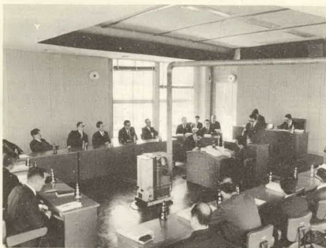
3 月定例町議会議・本会議