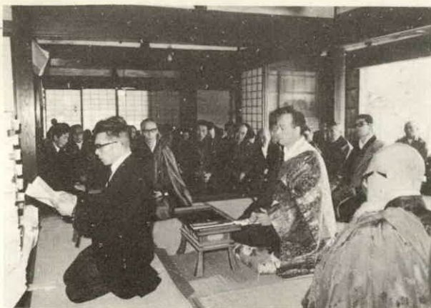
写真は、祭文を読み上げる浜岡町長(棚橋・法光寺で)

第十六回の町主催戦没者慰霊祭は、三月十八日慶林寺(麻加江)、法光寺(棚橋)、九日金竜寺(中之郷)、報光寺(市場)の四会場で、遺族約四百人が参列して、しめやかに行なわれました。 式典は、まず浜岡町長が日清戦争以後の四百六十三柱の殉国英霊位を前に「現在の繁栄も犠牲となられた諸英霊のおかげ」と祭文を読みあげたあと、追善供養の読経が行なわれ、遺族の方々が焼香を行ない、故人のめい福を祈りました。 また、梅花講の方々によるご詠歌の奉詠も行なわれました。 この日、町から各遺族に塔婆と菓子折りが贈られました。