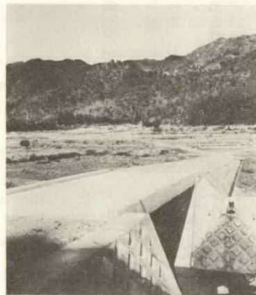
↑ 永久橋にかけ替えられた脇出の農道橋

昭和四十五年度も、あますところあと僅か。各事業とも、いよいよ最後の仕上げにはいっていますが、四十五年度に行なわれました各事業のおもなものを写真で紹介しましょう。 まず、継続事業では、最終年度の農業構造改善事業と第二年度にはいった宮川架橋の農免農道事業、それに第一年度事業開始の山村振興事業が予定どおり進み、県道・町道の改良工事、舗装工事なども順調に行なわれています。 また、念願の明野高校度会分枝体育館建設工事は内装を終え完成も間近です。