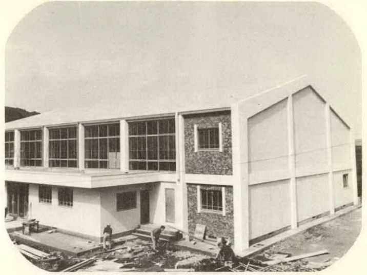
↑ 明野高校度会分枝に、念願の体育館が完成。3月3日 ほぼ完成した体育館で卒業式が行なわれた

昭和四十五年度も、あますところあと僅か。各事業とも、いよいよ最後の仕上げにはいっていますが、四十五年度に行なわれました各事業のおもなものを写真で紹介しましょう。 まず、継続事業では、最終年度の農業構造改善事業と第二年度にはいった宮川架橋の農免農道事業、それに第一年度事業開始の山村振興事業が予定どおり進み、県道・町道の改良工事、舗装工事なども順調に行なわれています。 また、念願の明野高校度会分枝体育館建設工事は内装を終え完成も間近です。