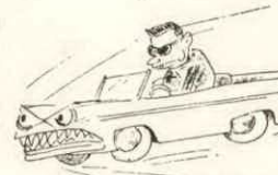
公衆の敵とならないように

いほど発生しやすいので、これを防ぐために、ある程度タイヤと空気圧を高め(二十、三十パーセント)にすることも必要です。 以上、いろいろの自動車に影響を及ぼす現象を述べてみました。安全運転の第一歩は、まず始業点検を励行し、安全運転を第一と心得て交通事故ゼロに努力しましょう。