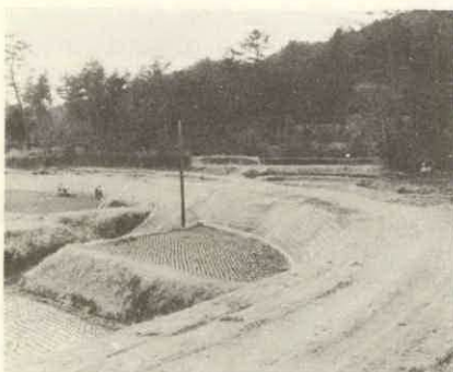
↑ 山村振興事業として、今年度から4カ年計画で改良が始まった町道麻加江注連指線