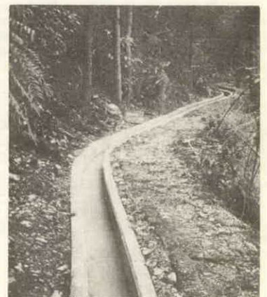
↑ 山村振興事業の特別開発事業で完成した用水路一坂井