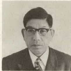
町 議 会 副 議 長 杉 本 光 郎