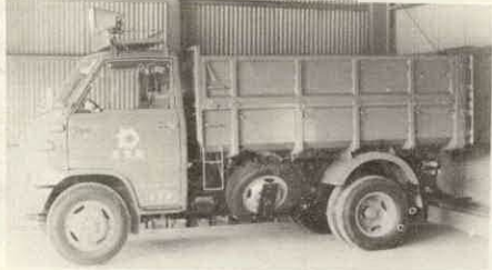
納入された収集車

ガラス、セトモノ、金物などの燃えないゴミは、不燃物用のゴミ袋に入れて指定された場所に、きちんと整理して出して下さい。