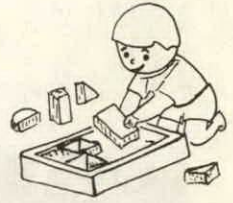
【あとかたづけのできる子に】

せんが、一般的に申しますと、さしあたり次のような点を、しつけておきたいものです。