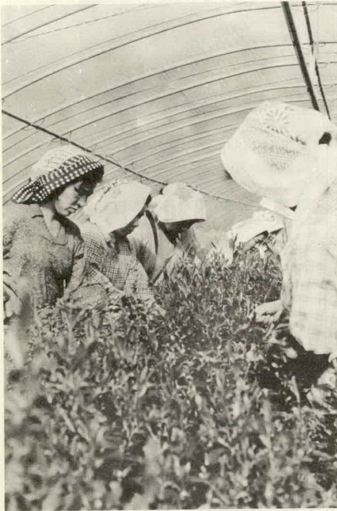
ハウスの中で一番茶をつみとる会員たち（平生にて）