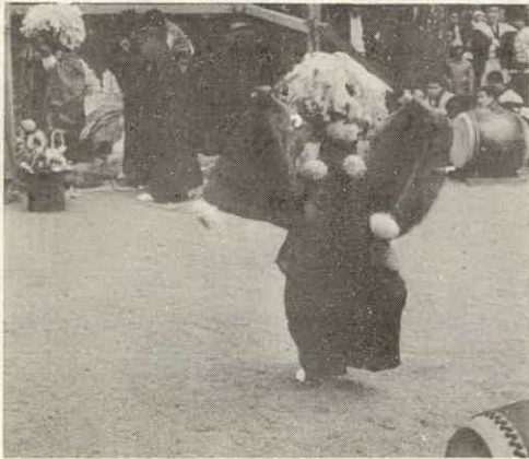
一之瀬神社のお頭神事

す。文化財の保護は、住民一人一人の問題として真剣に取りくんでいくとともにすぐれた度会町の文化を後世に伝えていきたいものである。