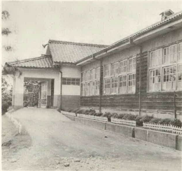
六学級を誇る内城田中学校

現在内城田中学校は六学級で、生徒数は百六十一名、教員数は校長先生を含めて十二名、中川中学校は三学級で、生徒数百八名、教員数七名、