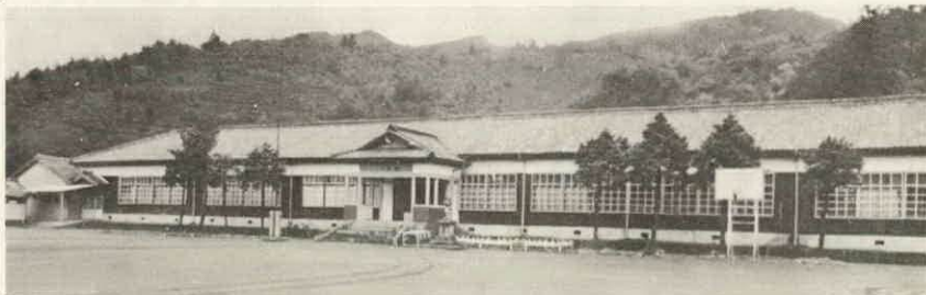
全校生徒八十三人の小川郷中学校

をえがいていますが、なんといっても町民諸民のご理解の上になんか進めるものでなければなりません。皆様的心からなる賛意と、度会町の将来や教育の方向を町民みんなのものとして取り組んでいきたいと思えます。