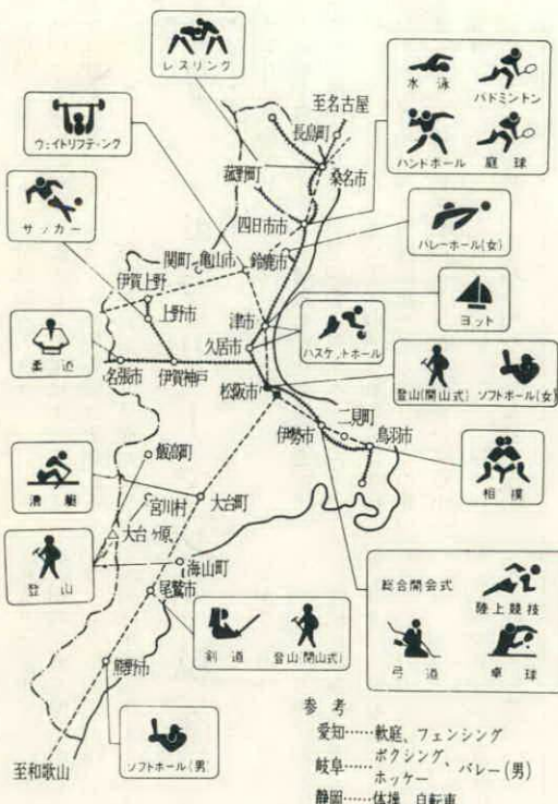
高校総体競技会場