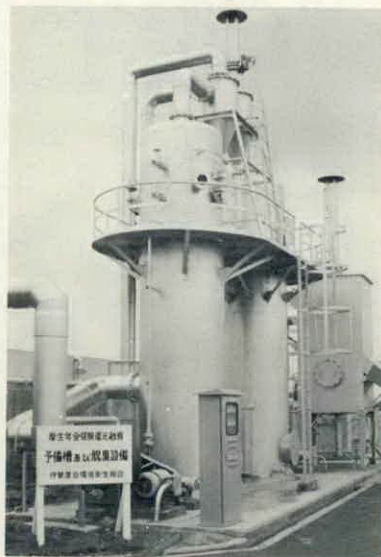
新設された 新鋭脱臭装置