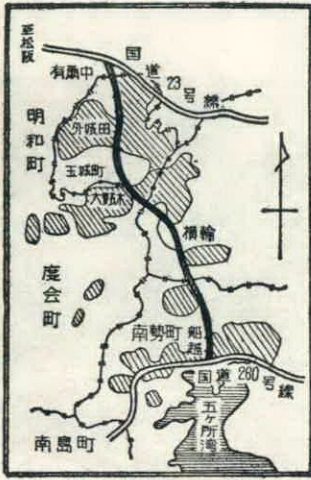
予定されている経路地図

明和町から南勢町を短距離でつなぎ、両国道を結ぶことで観光や地域開発にも大きなメリットがあると考えられています。 計画によると、同農道は明和町有爾中地内の国道二十三号線から南勢町船越地内の国道二十六号線を結ぶ延長四・四キロ、このうち玉城町勝田一伊勢市上野の七・一キロと南勢町伊勢地一船越の四・九キロを県営による基幹農道整備事業として四十八年度から五十二年度にかけて十二億円で着手するもので、残りの十二・四キロは建設省の事業として、十三億円で取り組むことになっております。幅はいずれも七・五メートルの二車線で、このうち県営による十二・四の内訳は道路が十・二キロ、宮川にかかる橋りょう（四カ所）が二百五十メートル、その他隊道（四カ所）が千五百四十メートルとなっております。