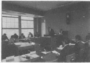
(提案説明する助役)

◇ 専決処分の承認については、広域消防庁舎建設事業債六百万円が、六百八十万と融資額が決定されたためこの措置として、地方債の補正および一般会計予算の財源内訳の変更および浜岡町長急逝にともなう町葬予算補正などを可決。