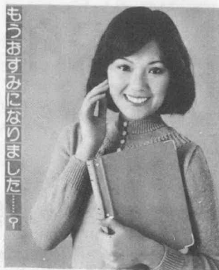
ぜひおすめになりましょう

贈与税の申告は二月一日から、所得稅の確定申告は二月十六日から、それぞれ受付がはじまっています。どちらも申告期限は三月十五日までですが、期限間近になると税務署の窓口は大変混雑し、落ち着いて相談ができなかったり、長い時間待っていたり、お気もなりますので、申告はできるだけ早く済ませるようにしてください。