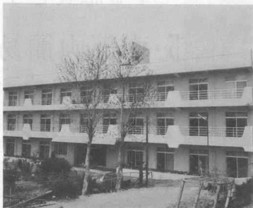
—完成した老人ホーム高砂寮—

昭和五十三年度の事業として昨年からの建設が進められてきました。度会郡町村老人福祉施設組合の養護老人ホーム高砂寮が、このほど完成しました。