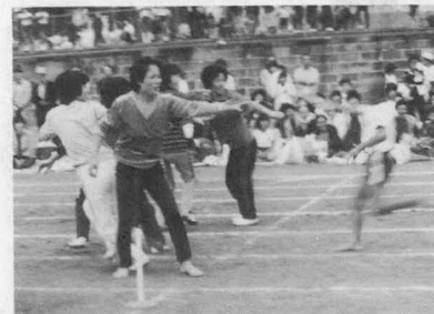
▼音感リレー(小学生)

お昼には、ハワイアン風の曲にのってあざやかな衣裳に趣を凝らした同好会の皆さんが、ムードあるダンスを披露してくれました。