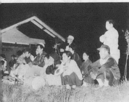
▲ 応援団もハッスル