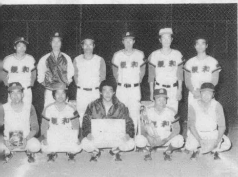
▲ 準優勝の親和クラブA