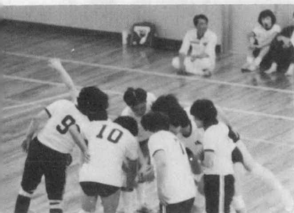
▼ さあ ガンパロウー