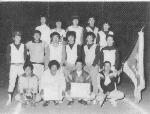
▲ 優勝した棚橋パワーズ

第九回ママさんバレーボール大会は九月十九日(日)に度会中学校体育館で行われ、子供達や夫の声援のもと、熱戦が繰り広げられました。 試合は六チームにより、まずトーナメント勝者三チーム、敗者三チームを決定し、勝者によりリーグ戦で上位一・三位までを、また敗者によりリーグ戦で下位四・六位を決定する方法がとられました。 リバースは三試合に一セットを落しただけで四年連続の優勝を成しとげました。 成績は次のとおりでした。 優勝 リバース 準優勝 度会ソフトリー 三位 セト 四位 平生 五位 大野木 六位 上久具