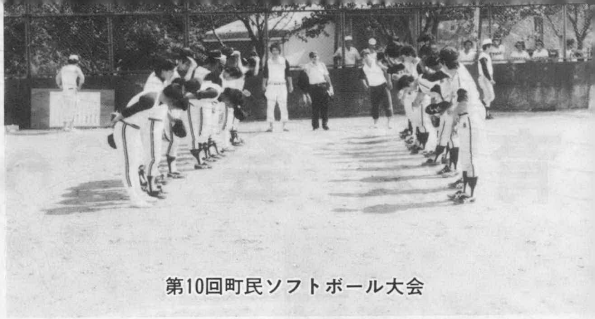
第10回町民ソフトボール大会