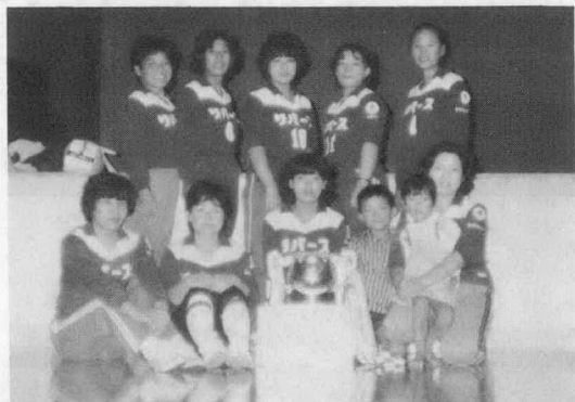
▲ 強いママさん — リバース

第九回ママさんバレーボール大会は九月十九日(日)に度会中学校体育館で行われ、子供達や夫の声援のもと、熱戦が繰り広げられました。 試合は六チームにより、まずトーナメント勝者三チーム、敗者三チームを決定し、勝者によりリーグ戦で上位一・三位までを、また敗者によりリーグ戦で下位四・六位を決定する方法がとられました。 リバースは三試合に一セットを落しただけで四年連続の優勝を成しとげました。 成績は次のとおりでした。 優勝 リバース 準優勝 度会ソフトリー 三位 セト 四位 平生 五位 大野木 六位 上久具