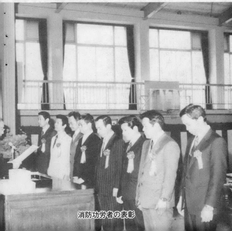
消防功労者の表彰

町長の式辞に続いて、功労者二十五名の表彰が四部門に分れて行われ、感謝状贈呈も四部門十名の方々に贈られました。