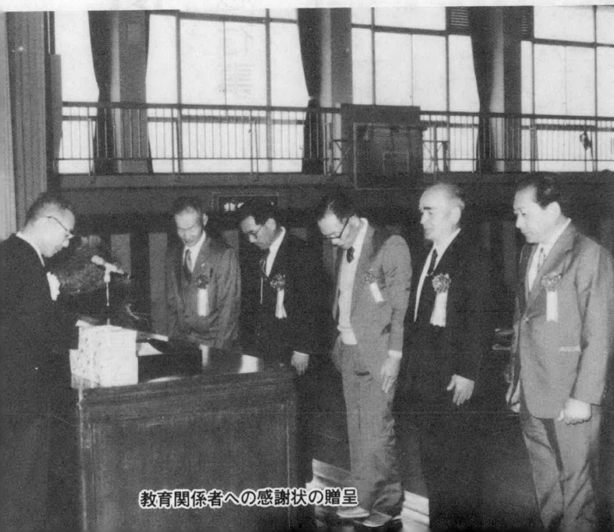
教育関係者への感謝状の贈呈