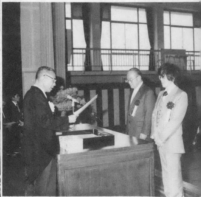
わたらい音頭制定協力者への感謝状の贈呈