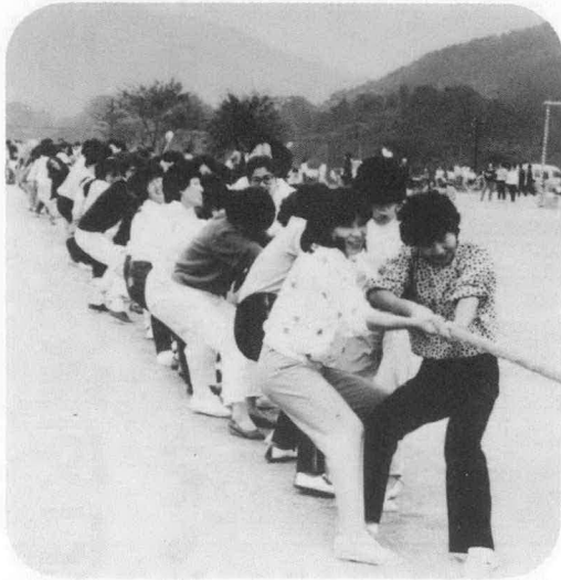
へっぴり腰では勝てません