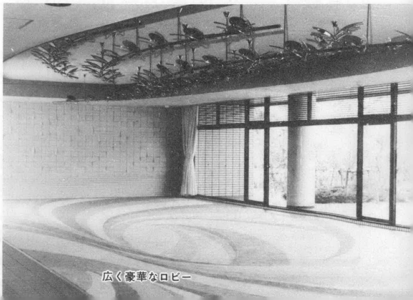
広く豪華なロビー