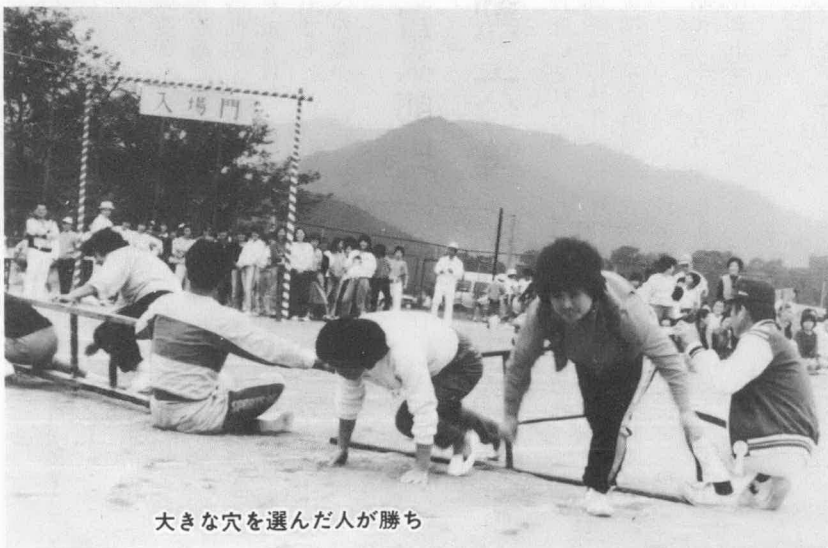
大きな穴を選んだ人が勝ち