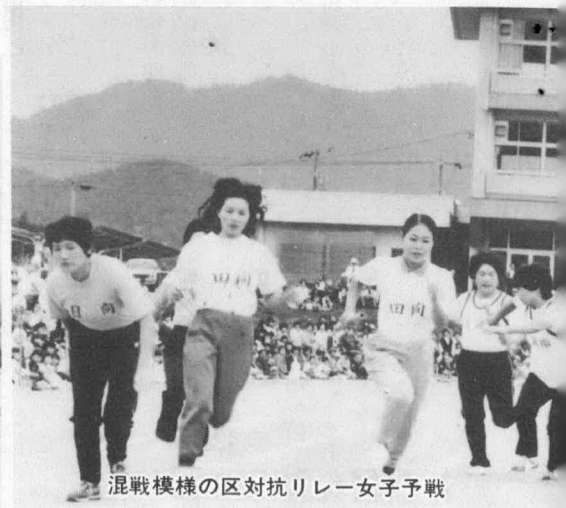
混戦模様の区対抗リレー女子予戦