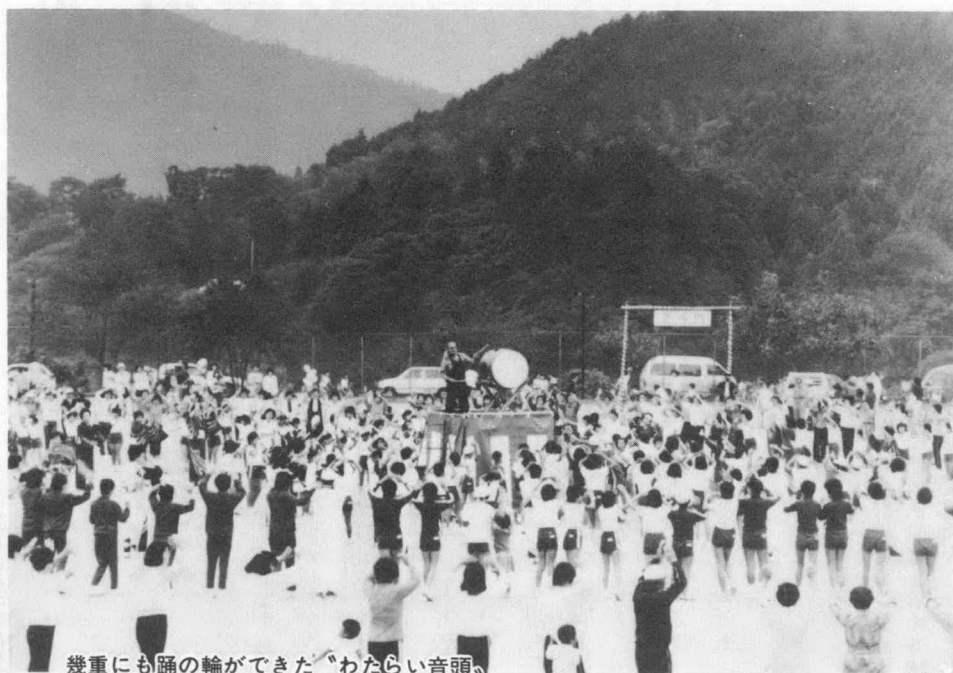
幾重にも踊の輪ができた「わたらい音頭」

低く垂れこめた雲、今にも降り出しそうな朝の天気 に開会が危ぶまれた今年の町民体育大会でしたが、ど うやら一日天気は持ちました。むしろ「降らず照らず」 でスポーツを楽しむには絶好の天気でした。 十月十日の体育の日の行事として、すっかり定着し た町民体育大会は、回を重ねて今年で十二回を迎えま