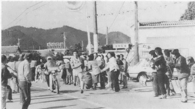
沿道の観衆に励まされて