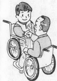
サラリーマン世帯の標準年金額

す。また、二十歳前の傷病によって障害者となった人についても、二十歳に達した月から、障害基礎年金が支給されます。(従前