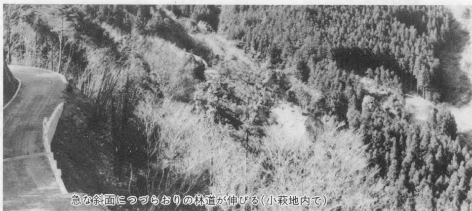
急な斜面につづらおりの林道が伸びる(小萩地内で)