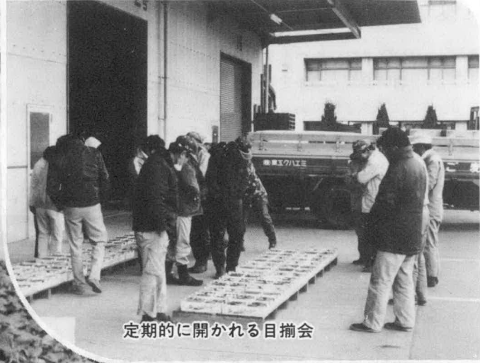
定期的に開かれる目揃会