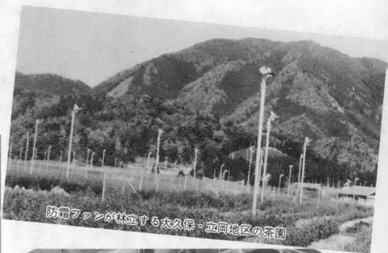
防霜ファンが林立する大久保・立岡地区の茶園

昭和五十六年度から毎年度県営事業で小萩側と麻加江側の両方から工事が進められており、今年度は六千万円の事業費で約七百三十メートルの開発が進みました。今年度の開発を含めて麻加江側、小萩側とも約二千七十メートルが完成しています。