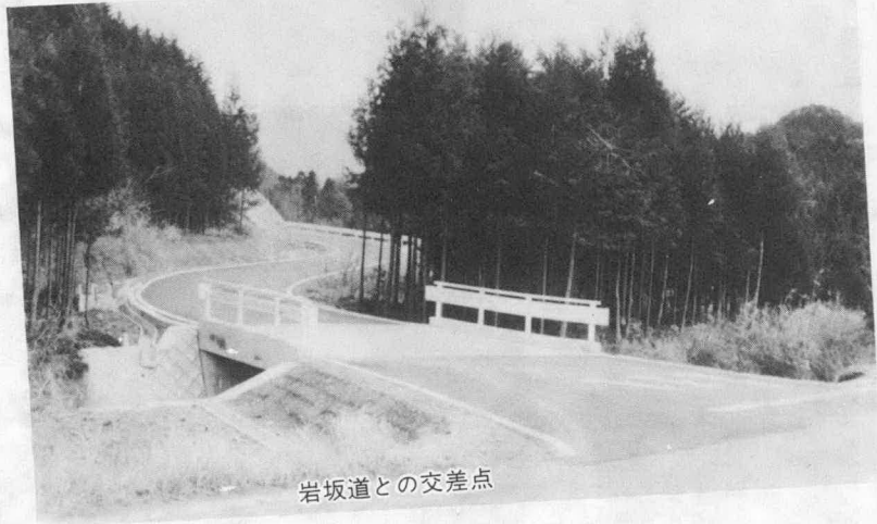
岩坂道との交差点

昭和59年度からの継続事業で、本年度は 1,130万円の事業費で橋梁整備と路面舗装が行われ、本年度で全部完成しました。総事業費 6,600万円。