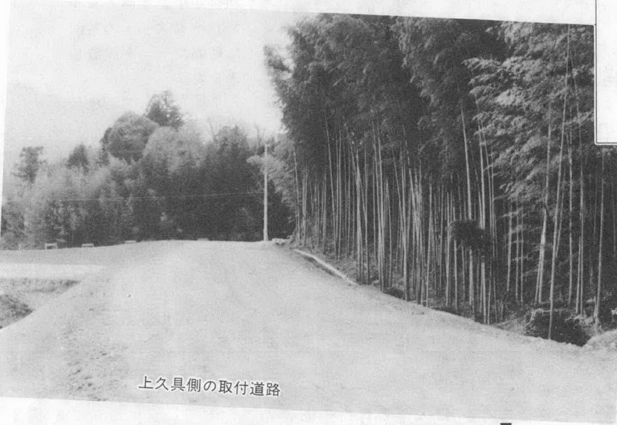
上久具側の取付道路

▼久具都比売橋整備事業 宮川の久具の渡しへの架橋事業で、本年度は上久具側の取付道路、遺跡調査、地質調査、用地買収などが六千二十万円の事業費で行われました。 完成すれば、橋梁部分が二百六十メートル、取付道路部分も二百六十メートルで、いずれも幅員は七メートルとなります。内城田川南地区住民にとっては待望久しい橋だけに、早期完成が待たれています。