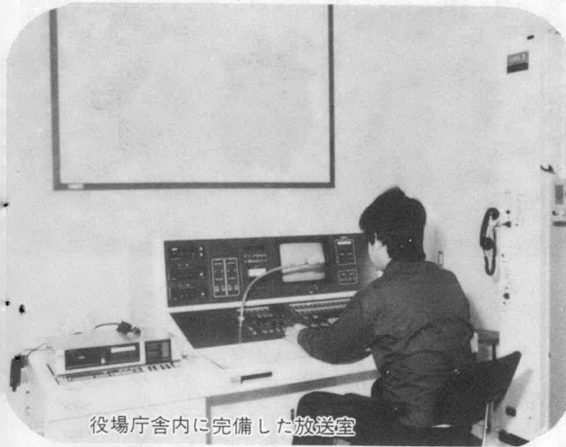
役場庁舎内に完備した放送室

役場の放送室から町内へ一斉放送や一部地域を選択した放送ができます。事業費12,700万円。