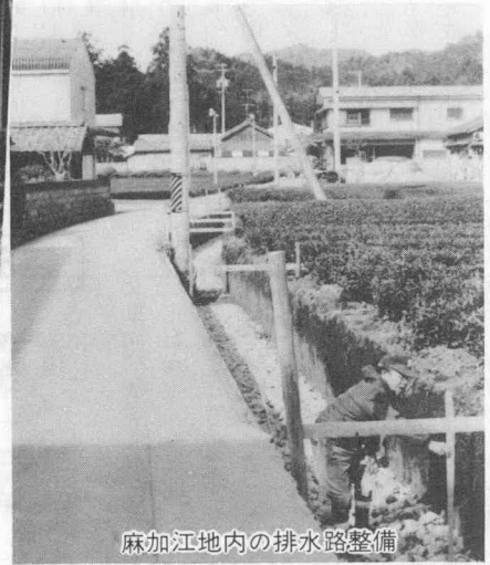
麻加江地内の排水路整備

▼棚橋用排水路の整備事業 農村基盤総合整備事業の一環として、棚橋地区で進めている用排水路の整備事業。幅一・三メートルの農地の用排水路を六百六十メートル布設するもので、事業費三千四百四十万円。