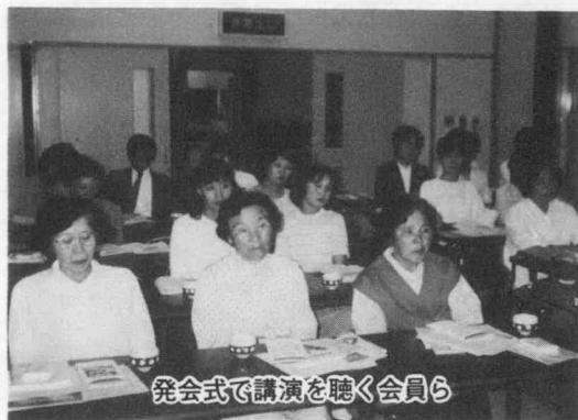
発会式で講演を聴く会員ら

この貯蓄実践地区は、生活の合理化などを通して貯蓄の実践活動をするもので、教育・住宅・老後など将来設計への備えとして、生活の中での浪費をなくし、合理的、計画的なお金の使い方