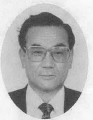
無現3 60歳 中之郷 農業

近畿自動車道、サニー道路が開通すれば、度会町は名実ともに度会郡の中心的存在となります。将来性のある夢多き度会町の発展のため、努力したい。