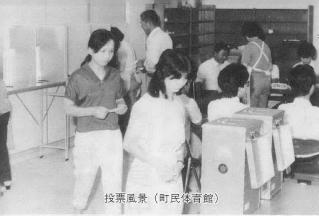
投票風景 (町民体育館)