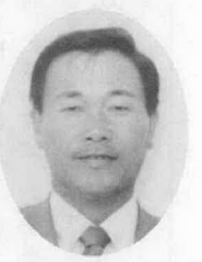
無新1 50歳 南中村 農業

皆様のお声を町政に反映させ、明るく住みよい豊かな町づくりと併せて基盤整備の早期実現、地場産業の振興に努力いたします。