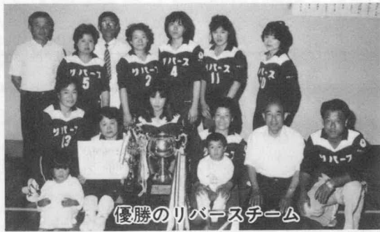
優勝のリバースチーム

物知りたちを自分の弟子として集団をつくり、多くの若者達が孔子の門に集った、彼らを「士」と呼ぶようになり、一つの階級ができたのである。論語の初めに「朋あり遠方より来る」とは弟子達が大量集って来た様を言ったものである。