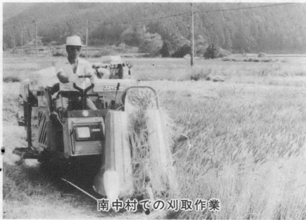
南中村での刈取作業

ことしは、播種時期が好天で生育も順調でしたが、五月中旬にかけての干天続きで早期登熟気味の地区もあり、粒数が多いわりに粒形が小さく、平年作をやや下回る作況でした。