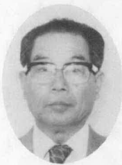
無新1 64歳 当津 会社役員

農業の生産基盤の確立と企業誘致に努力する。高速道路、空輸時代を迎え、峰越林道や山の尾根づたいに林道を開設し、企業誘致と両立させたい。