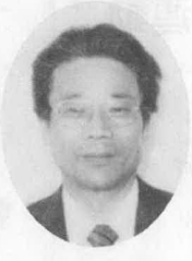
無現3 51歳 下久具 会社役員

豊かな自然を守りながら、町民みなさんと共に、立ち遅れている農地の基盤整備に全力で取り組みます。