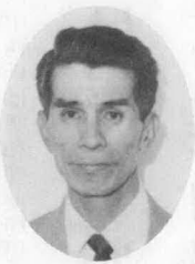
無新1 58歳 平生 農業

△初心を忘れず頑張ります。 △行政の日陰を無くし、行政サービスへの公平化に努めます。 △住民福祉の向上を図り、豊かな住みよい町づくりに努めます。