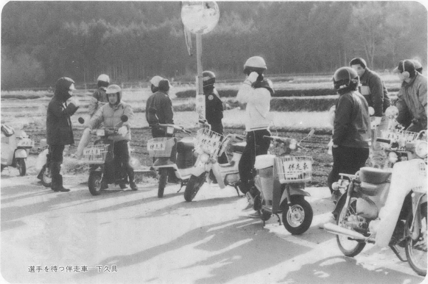
選手を待つ伴走車一下久具