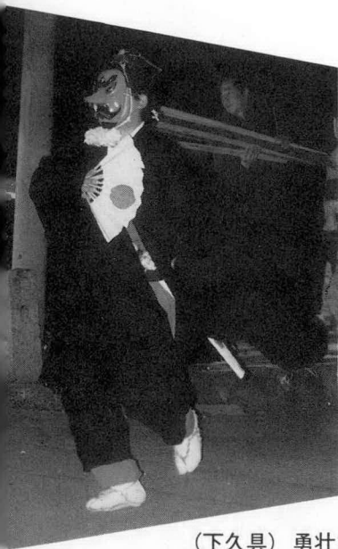
(下久具) 勇壮な天狗舞い (市場)