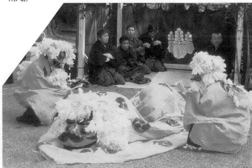
ちょっと、ひと休み (南中村)